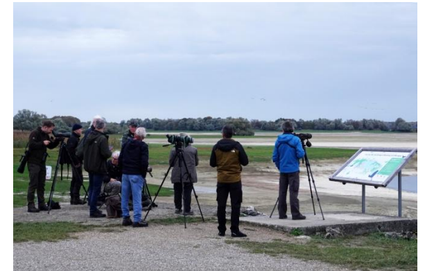
Genieten bij Lac du Der (CS).

Zaterdagochtend, het is Allerheiligen en daar wordt in Frankrijk bij stilgestaan. In de omgeving zijn ongeveer alle winkels en bedrijven dicht. Er is bijna niemand op straat. Bepaald geen dag om een kapotte band te laten plakken. Een goede reisverzekering doet dan wonderen, zo wordt mij weer eens duidelijk.