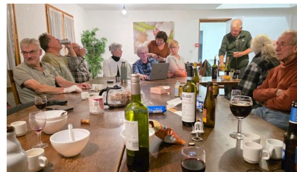
Slaapmutsjes & knabbels (CS).

Moe maar zeer voldaan nuttigen we ons zelfgemaakt avondeten. Nog een slaapmutsje en daarna op tijd de oogjes toe.