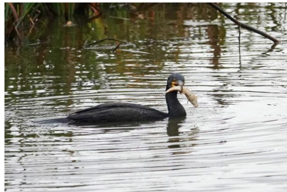
Aalscholver heeft beet (Wim Deebe).

Zondagochtend geen spectaculaire zonsopkomst. Maar de aanblik van een IJsvogel maakt het vroege opstaan de moeite waarde. Spectaculair zijn ook de grote aantallen Aalscholvers. In een visrijk deel van het meer verzameld zich een groep van naar schatting 4000 exemplaren, die vervolgens samen visjes gaan vangen. Wat een goede samenwerking zeg... daar kunnen ze in Den Haag nog wat van leren.