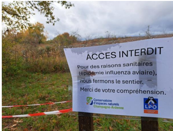
Helaas niet toegankelijk.