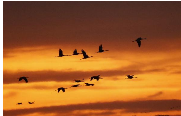
Kranen tijdens de spectaculaire zonsondergang (Peter Simon).

lijk. Zearend is ook al waargenomen. Maar het hoogtepunt is natuurlijk de inkomende stroom van duizenden, luid trompetterende Kraanvogels. Uit alle richtingen komen ze aanvliegen. Dit in combinatie met een werkelijk spectaculaire zonsondergang maakt dit natuurverschijnsel een zeer indrukwekkende, onvergetelijke belevenis.