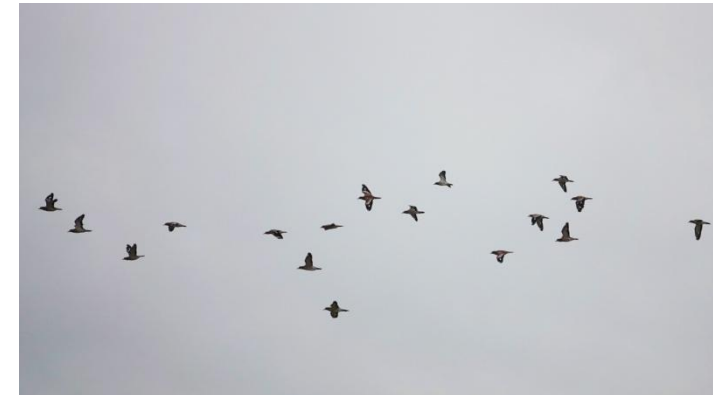
17 van de 32 Grielen (Wim Deebe).

akker een groep Beverratten. Best wel grote beesten. De Grielen zitten er nog. We staan op grote afstand en in de telescoop tellen we er 32. Grote blij. Een jager struint door de akker en zorgt er zo voor dat we de groep ook in een gezamenlijke vlucht kunnen aanschouwen.