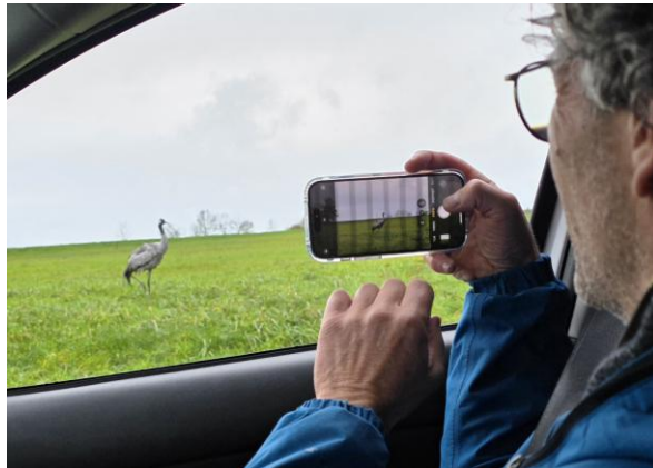
Té tamme Kraanvogel... (CS).

op de oevers, in de omgeving, op de velden, overall liggen kadavers van deze majestueuze vogel. Je kunt er niet omheen. Vogelgriep heeft deze soort in zijn grip. Triest. De aanblik van ronddwalende, zieke vogels houdt de gemoederen bezig. Het kan er soms heel hard aan toe gaan in de natuur.