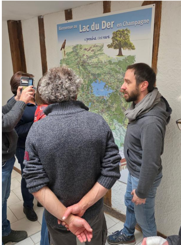
De beheerder van de kampeerboerderij geeft uitleg bij een grote kaart (CS).

zaal waar we met z'n allen kunnen samenzitten, een uitgebreide keuken en voldoende parkeerplek ook. Goed uitgekozen door de organisatie. De beheerder is ons behulpzaam. Er hangt een grote landkaart aan de muur en daarmee legt hij ons uit waar de leuke plekken zijn en welke mooie routes je kan lopen in de buurt.