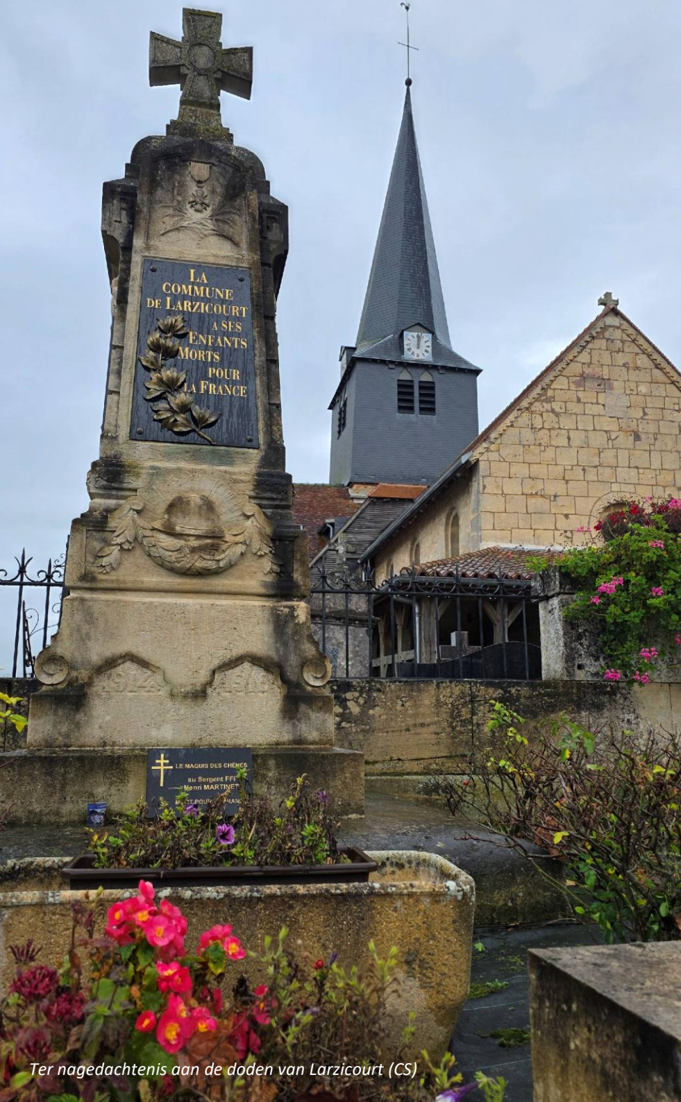
Ter nagedachtenis aan de doden van Larzicourt (CS)