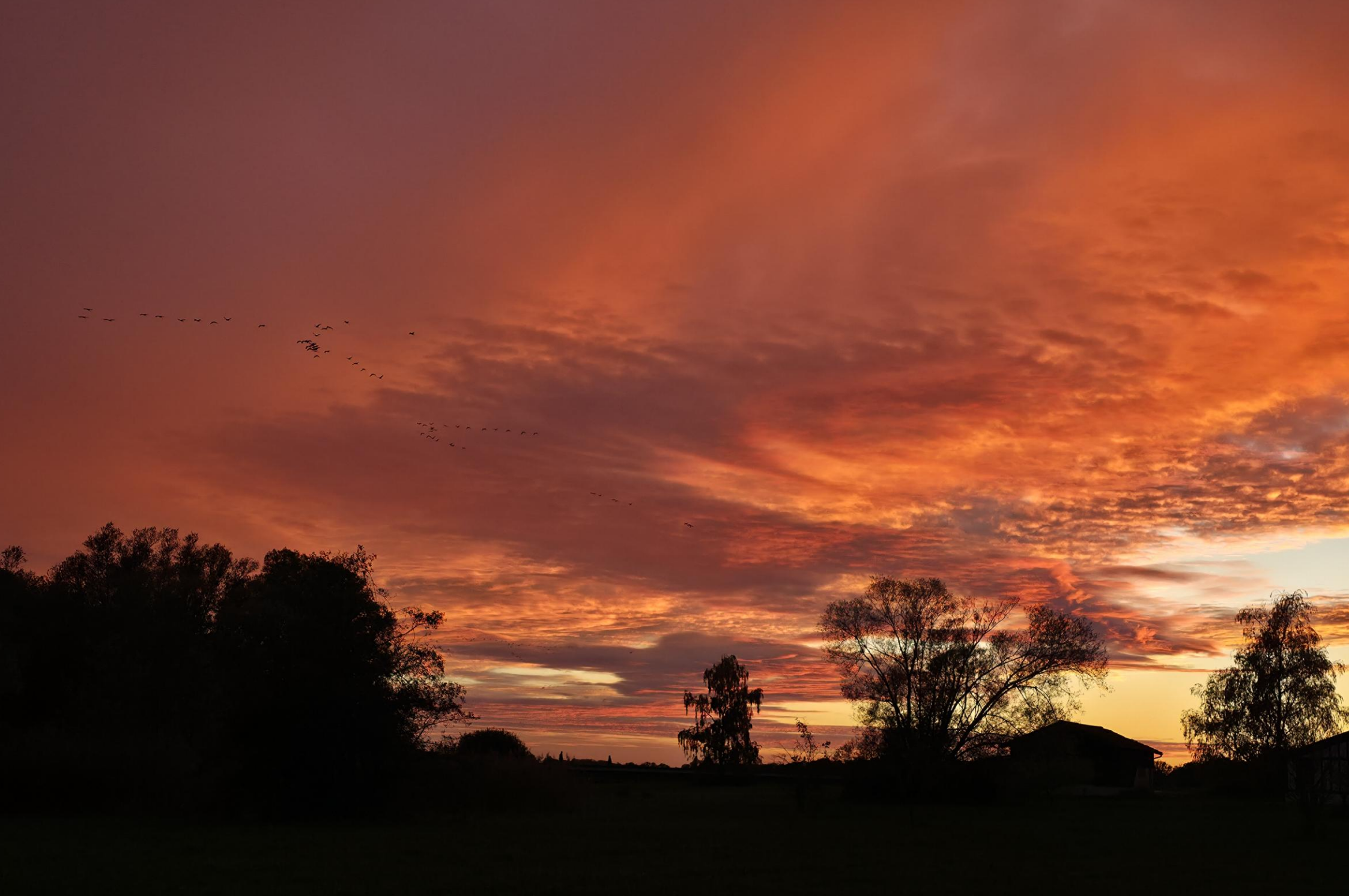
Kraanvogels en spectaculaire zonsondergang bij Lac du Der-Chantecoq, 31 oktober 2025