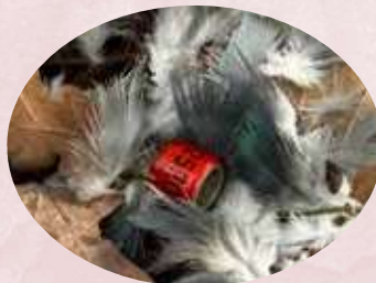
Ring wedstrijdduif, 4 oktober 2025, Hilversum

De Zomertortel is de enige duif die niet in de stad voorkomt.