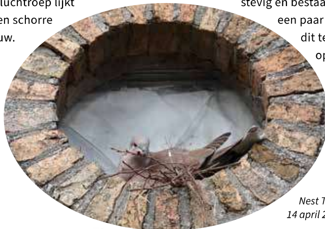
Nest Turkse Tortel, 14 april 2025, Schiermonnikoog

De Turkse Tortel met zijn mooie kleine zwarte nekstreep is een relatieve nieuwkomer. In 1950 vond het eerste broedgeval plaats en nu zijn er ongeveer 68.000 broedparen. Vooral in groene stadswijken, dorpen en op boerderijen. Als je veel met de trein reist, is de kans groot dat je onder de overkapping van het station broedende Turkse Tortels tegenkomt. De nesten zijn niet echt stevig en bestaan vaak maar uit een paar takjes, vooral als dit tegen een gevel of op een balkon wordt gebouwd.