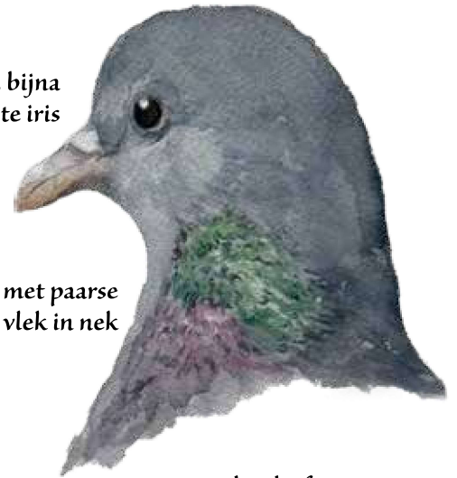
donkere, bijna zwarte iris