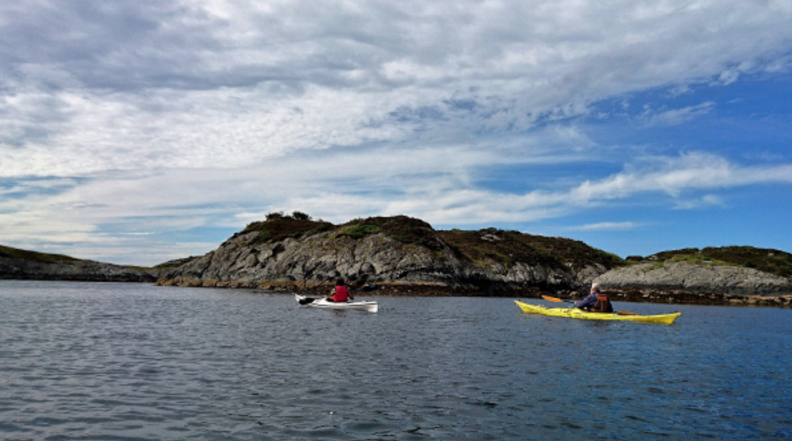
Kajakken bij Sognefjord, Noorwegen

Bijvoorbeeld bij het horen van de 'zang' van een gewone dwergvleermuis op de batdetector, waarmee je het geluidsfragment in frequentie verlaagt en tienmaal vertraagt. Of als je in een kilometers breed rivierdal in het verre noorden na enige tijd door de verrekijker een groepje rendieren ontdekt. Het gaat daarbij niet om de bijzondere waarnemingen van zeldzame zoogdiersoorten, maar het is de context waarin je een 'gewonere' diersoort beleeft. Een heel andere vorm genieten ervaar ik als redacteur van Lutra om auteurs aan te zetten om de inspanningen van hun onderzoek tot een fraaie parel op te poetsen. Vaak is dat een hele bevalling, maar als het eenmaal achter de rug is, blijkt het een resultaat te zijn om met plezier aan terug te denken.