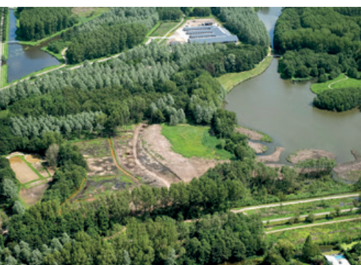
▲ Realisatie van bosstroken door alle overige bomen te kappen.