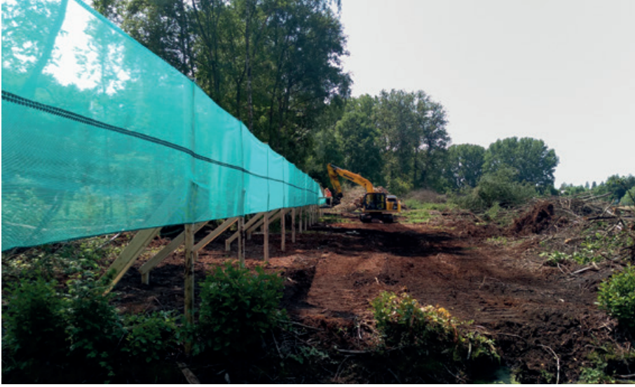
▲ Plaatsing van de eerste vleermuisschermen naast de behouden bosstrook.

harde wind dicht op het scherm vliegen. Die indruk was er ook op dagen met wat meer wind, maar bij echt sterke wind is geen onderzoek gedaan. Na het vervangen van de oorspronkelijke vleermuisschermen door de hogere schermen bleef het gebruik vergelijkbaar, maar vlogen de dieren zoals te verwachten ook op grotere hoogte. Het volgen van het scherm in vlieghoogte wijst erop dat de dieren zich echt richten op deze geleiding en beschutting, zelfs als zij tot op 5 meter afstand van het scherm vlogen.