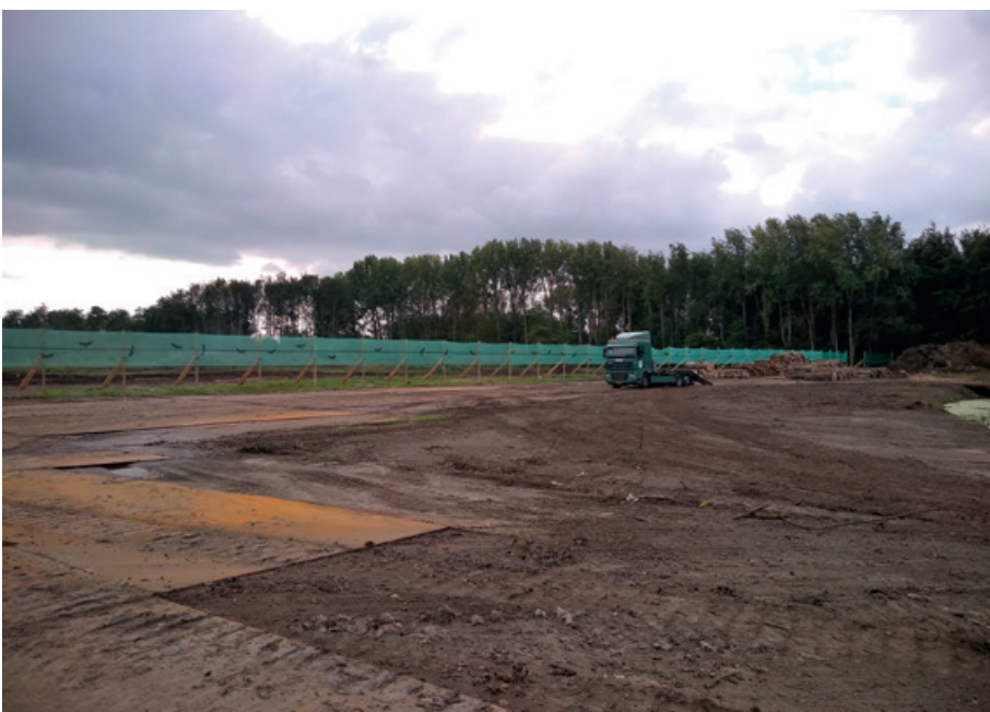
▲ Vleermuisscherm na verwijdering bosstrook.

BENJAMIN BACKX werkt bij Eco Assist en leidde het monitoringsonderzoek. JEROEN DEMMER is ecooloog bij Dura Vermeer, bedacht de maatregelen en was betrokken bij de monitoring.