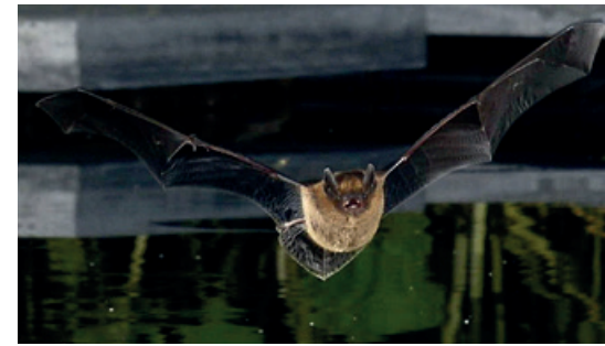
▲ Gewone dwergvleermuis.

De aangetroffen aantallen gewone en ruige dwergvleermuizen zijn zo hoog dat zowel de toegepaste bosstroken als vleermuisschermen als effectieve maatregel gezien