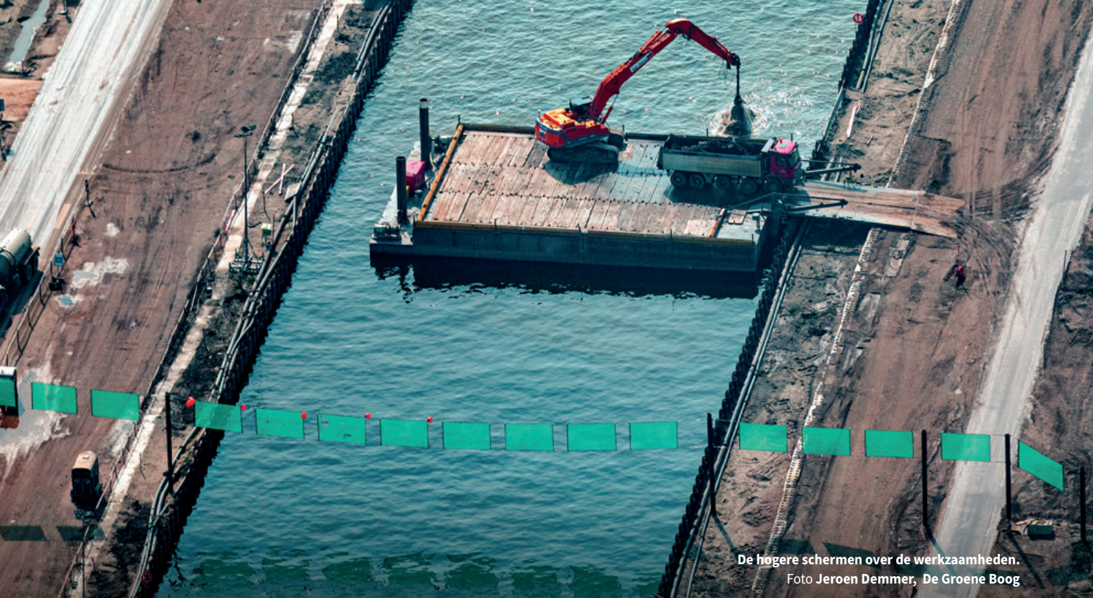
De hogere schermen over de werkzaamheden.

ONDERZOEK NAAR MITIGATIEMAATREGEL BIJ BOUWWERKZAAMHEDEN