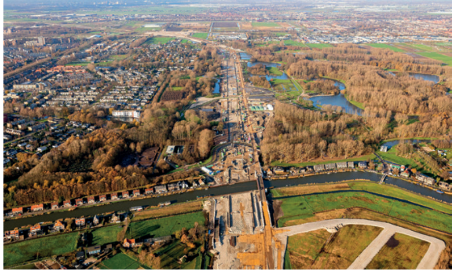
▲ Doorkruising Lage Bergse Bos ten behoeve van de bouw A16 Rotterdam.

Alle bomen tussen deze stroken zijn gekapt.