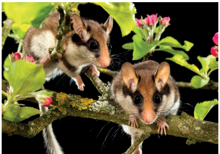
▲ Eikelmuisen voeden zich met zowel dierlijk als plantaardig voedsel.

implicaties voor de bescherming van de soort. Beschermingsinspanningen kunnen zich best richten op het behouden van de algehele gezondheid en integriteit van de ecosystemen waarin eikelmuisen leven. Het beschermen van habitats die diverse voedselbronnen voortbrengen (op een niveau per territorium, dus pakweg 0,5-1 km diameter) en het creëren van verbindingen tussen deze leefgebieden is dus een must voor de soort. Daarbij moet er aandacht zijn voor de seizoensgebonden voedingsbehoeften in relatie tot de verschillende levensfasen van de eikelmuis. De resultaten van de keutelanalyse tonen immers het belang aan van calciumrijke organismen tijdens de lente (voortplantingsperiode). Een actuele bedreiging voor dergelijke calciumrijke organismen betreft verzuring van de bodem door o.a. overmatige stikstofdepositie, wat leidt tot verminderde reserves aan calcium. Dergelijke cascade-effecten vanaf de onderkant van de voedselketen kunnen potentieel soorten als de eikelmuis bedreigen in hun calciumbehoeften. Dit is echter een hypothese die door verder onderzoek gestaafd zou moeten worden.