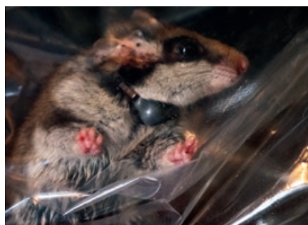
▲ Gezenderde eikelmuis.

In februari werden alle leden benaderd via e-mail. In dat bericht werd kort het dilemma geschetst waarvoor we staan. Daarnaast werd het proces geschetst tot de Algemene Ledenvergadering eind april met daarin de eerste stemming over de richting waarin we verder gaan. Om de enquête op de net vernieuwde website van de Zoogdiervereniging in te vullen moest op een grote groene knop in de mail geklikt worden.