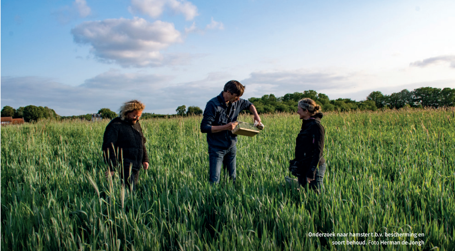
Onderzoek naar hamster t.b.v. bescherming en soort behoud.