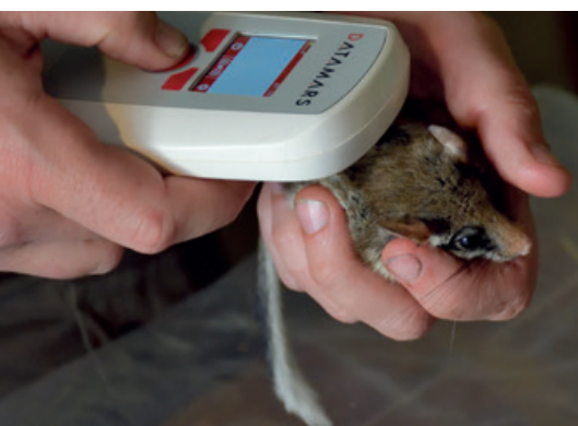
◀ Onderzoek naar Eikelmuisen in voorbereiding.

Het verschil in voorkeur voor onderzoek of bescherming is getalsmatig klein. Uit de gemaakte opmerkingen bleek dat verschil op gevoelsniveau veel groter. Waar argu-