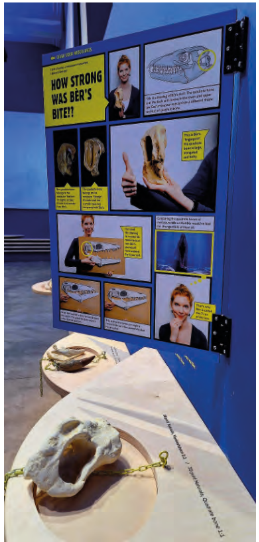
Fig. 12 (Onder). Met strak vormgegeven infographics en korte audioverhalen komt de bezoeker van de Mosasaurus Experience op een vernieuwende manier alles te weten over de Maastrichtse mosa's.