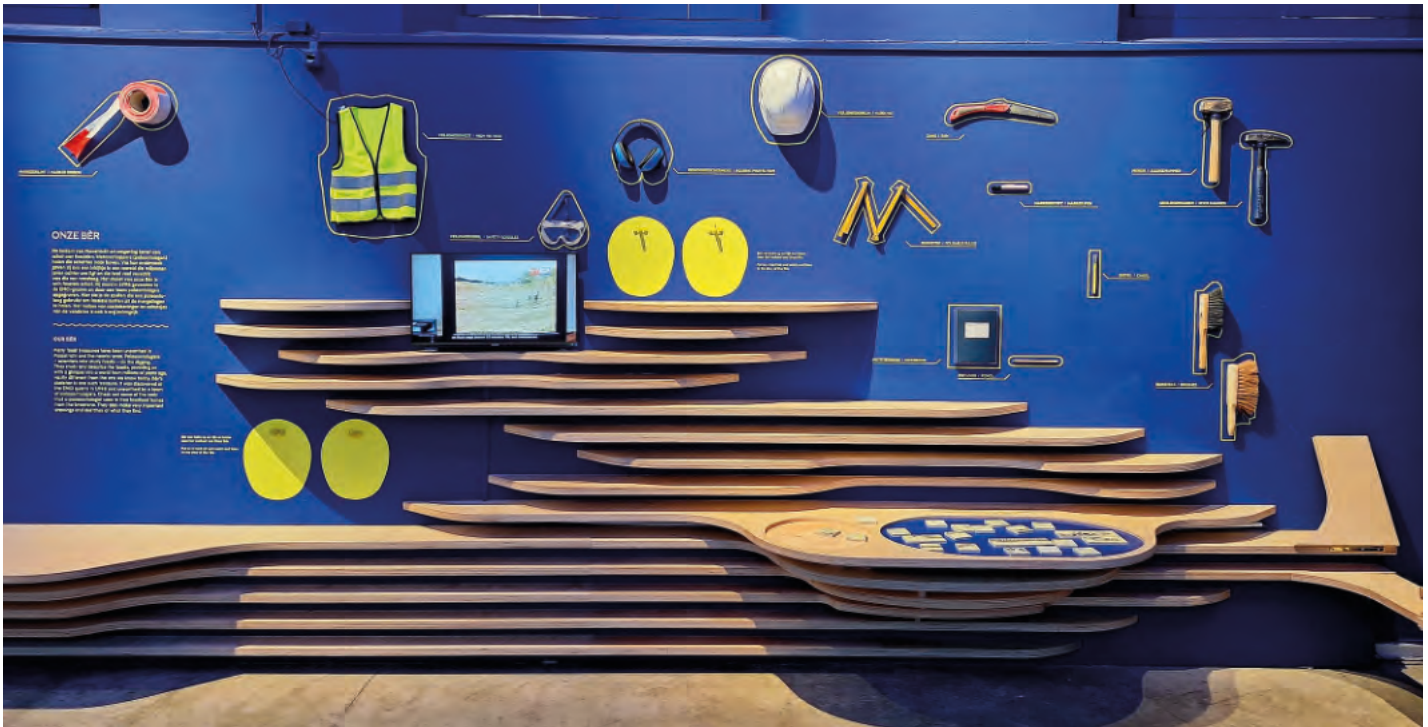
Fig. 10. De expo probeert een beeld te schetsen van hoe het opgraven van een mosa in zijn werk gaat. Dat gebeurt op diverse manieren: van het tonen van de benodigdheden van een paleontoloog in het veld en het lab, tot het zelf in elkaar puzzelen van een mosa-skelet voor de jongere bezoekers.