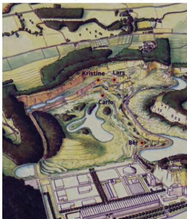
Fig. 1. De vindplaatsen van de mosasauriërs ‘Bèr’ (augustus 1998), ‘Kristine’ (augustus 2009), ‘Carlo’ (september 2012) en ‘Lars’ (april 2015), geprojecteerd op een deel van het Plan van Transformatie van de voormalige ENCI-groeve (Sint-Pietersberg, Maastricht).

lijken op dinosauriërs, en door menigeen ook voor dino's worden versleten. Dat zijn het echter niet – mosa's worden nauw verwant geacht met slangen en varanen. Tel daarbij op dat resten van mosa's op alle continenten, inclusief Antarctica, gevonden kunnen worden, en je kunt met recht zeggen dat deze dieren tot de grootste evolutionaire succesformules van de laatste 25 miljoen jaar van het Dinotijdperk behoorden. Het onderzoek naar deze mariene reptielen, die in een geologische oogwenk een grote diversiteit aan vormen bereikten en af ten toe zelfs nog eens terugkeerden naar zoetwater, is springlevend, getuige de speciale congressen en workshops die elke drie jaar worden georganiseerd. Wereldwijd houden rond 75 specialisten, inclusief hun studenten, zich bezig met de studie van mosa's. Thema's als verwantschappen, zowel onderling als ten opzichte van andere reptielgroepen (Caldwell, 1999, 2012; Polcyn et al. , 2022), evolutiepatronen (Polcyn et al. , 2014), anatomie en fysiologie (Lingham-Soliar, 1991, 1995; Lindgren et al. , 2011), tandwisseling (Caldwell, 2007), tandmorfologie en eetpatronen (Holwerda et al. , 2013, 2023), schubbenkleed en kleur (Lindgren et al. , 2009, 2010, 2013, 2014), paleohistologie (Street et al. , 2021) en hun plek in het ecosysteem (van Baal et al. , 2013; Schulp et al. , 2013;