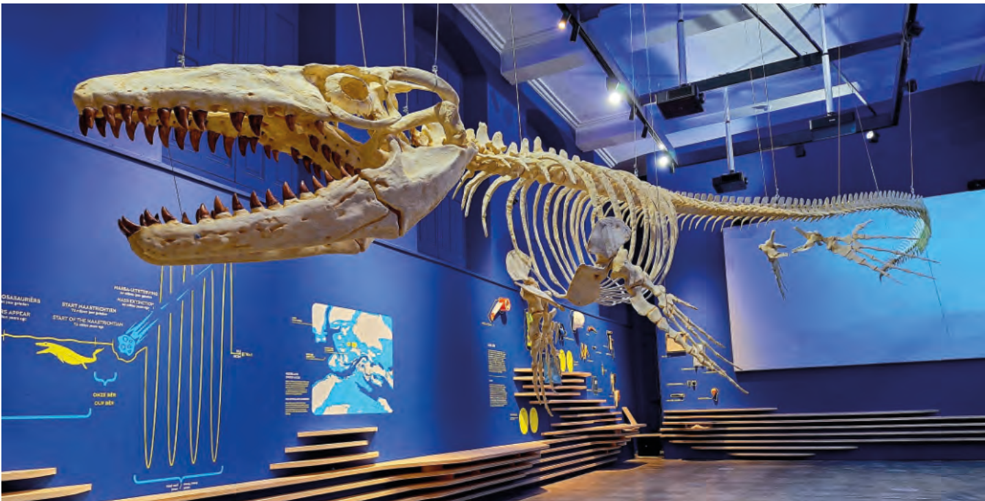
Fig. 9. Blik op de nieuwe expo, met het 3D-skelet van onze eigen 'Bèr', gereconstrueerd op ware grootte, als eye-catcher midden in de kapel.

Daarnaast gold: een spectaculaire vondst behoeft een vergelijkbaar onderkomen. Dat werd gerealiseerd op de binnenplaats van het museum: het Mosaleum. Hier ligt de schedel van 'Bèr' in volle glorie (fig. 6). Het type-exemplaar van de soort Prognathodon saturator is bij hoge uitzondering buiten de museummuren uitgesteld, simpelweg omdat het te groot en te zwaar is. Naast de grondvitruine staat een aantal kleinere vitrines opgesteld, met onderdelen van de benen oogring (sclerotica ring), een aantal wervels en haaientanden van de soorten die aan het kadaver hebben geknaagd en een rib met een laesie. Die laatste toont aan dat 'Bèr' tijdens zijn leven een aanvaring heeft gehad met een andere mosa, mogelijk duidend op territoriaal gedrag of een gevecht om een voortplantingspartner (Schulp et al. , 2004).