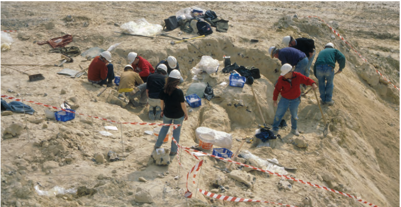
Fig. 2. De opgraving van 'Bèr' (voorjaar 1999) in de ENCI groeve; het blok in het midden herbergt de schedel.

Giltaj et al. , 2021) komen daarbij aan de orde, met steeds verder geavanceerde technieken