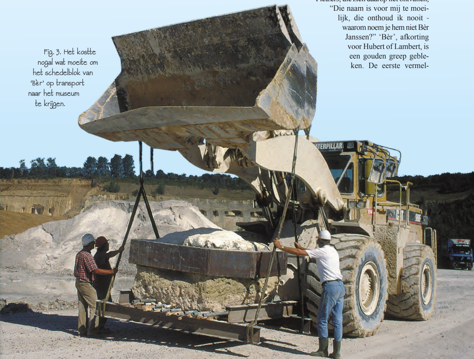
Fig. 3. Het kostte nogal wat moeite om het schedelblok van 'Bèr' op transport naar het museum te krijgen.

Pletzers, die zich daarop liet ontvallen, "Die naam is voor mij te moeilijk, die onthoud ik nooit - waarom noem je hem niet Bèr Janssen?" 'Bèr', afkorting voor Hubert of Lambert, is een gouden greep gebleken. De eerste vermel-