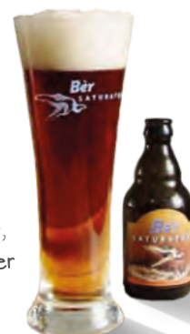
Fig. 8. Het speciale 'Bèr' bier, gebrouwen door de Gulpener Bierbrouwerijen.

In de tussentijd hadden we ook nog eens flink feest gevierd: de 150ste verjaardag van de introductie van het Maastrichtien, als jongste tijdseenheid van het Krijt (72.1-66.04 miljoen jaar; www.stratigraphy.org ), met een reizende expositie die Polen, Roemenië, New Jersey en Oman aandeed. Aan de ontbijttafel in Oman ontstond het lumineuze idee om een speciaal biertje, 'Bèr bier', te introduceren (fig. 8). Dat vloog de winkels uit.