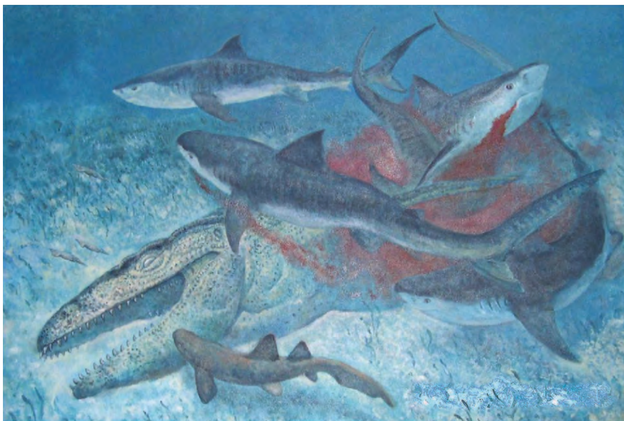
Fig. 7. Een artist's impression (van wijlen Dan Varner) van wat er met het kadaver van 'Bèr' gebeurd zou kunnen zijn.

en moest dus over het dak worden gehesen om op de binnenplaats te kunnen belanden. De kapel van de Grauwzusters, links van de ingang van het museum, werd omgetoverd tot heuse werkplaats – het 'Mosalab' (fig. 5). Daar konden bezoekers de preparateurs letterlijk en figuurlijk op de vingers kijken en met hen in gesprek komen over wat ze aan het doen waren en hoe belangrijke deze vondst wel was.