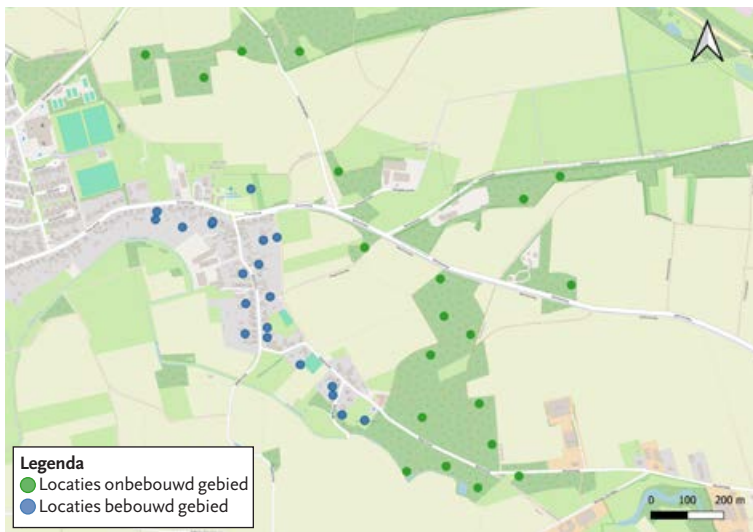
FIGUUR 5 De camera's hebben verspreid over het gebied gestaan, met in blauw de locaties binnen de bebouwing en in groen de locaties in het onbebouwde gebied.