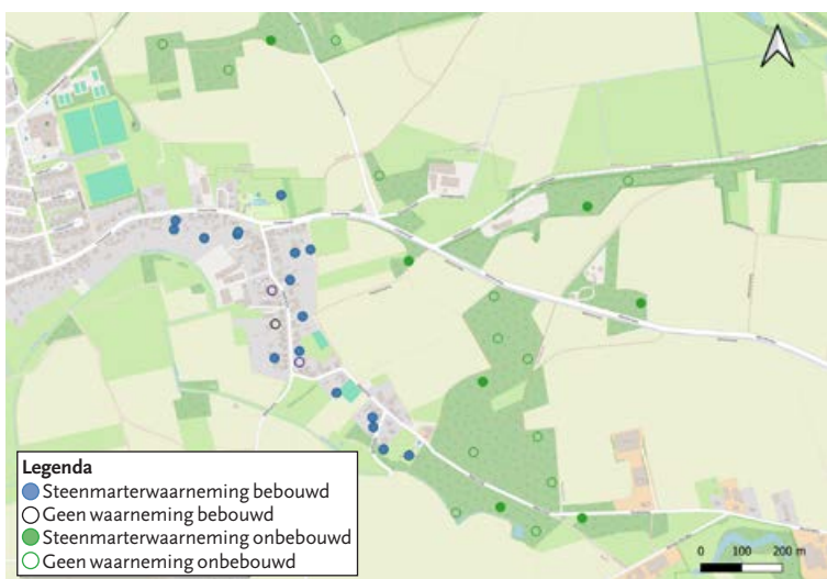
FIGUUR 6 In het bebouwde gebied (blauw) zijn op de meeste locaties (17 van de 20) Steenmarters ( Martes foina ) waargenomen. In het onbebouwde gebied (groen) werd het dier op veel minder locaties gezien (7 van de 20).

was [figuur 6]. Op de drie plekken in het bebouwde gebied waar géén Steenmarter op beeld is vastgelegd, werden wel sporen in de vorm van keutels aangetroffen bij de woning. Enkele van deze bewoners hadden ook schade ondervonden aan hun auto en pluimvee. De Vos ( Vulpes vulpes ) is echter diverse keren op de beelden verschenen in de hele buurt. Schade aan pluimvee kan in dit gebied dus niet enkel aan de Steenmarter worden toegeschreven. Naast de waarnemingen zelf lag ook de waarnemingsfrequentie beduidend hoger in de bebouwing. Bij het tellen van de waarnemingen is gebruik gemaakt van een zogeheten 'cool down' van minimaal twee uur tussen waarnemingen per locatie, omdat deze soms zo frequent waren in een korte tijdsspanne (5-10