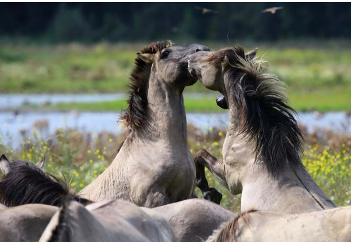
FIGUUR 8 Konikpaarden ( Equus caballus ) in de Oostvaardersplassen.

heeft plaatsgevonden, ook in officiële documenten. Zo was bij Arsbeck het goed de Aldeborg gelegen waaraan volgens VENNER (1985) in 1502 het recht was verbonden van “den stot van den wilden perden up Meynwech”, maar ligt Orsbeck bij Wassenberg waar in 1350 aan Steven van Orsbeke het recht verleend was “dat sine perde gaen moghen in ‘s-hertoghen bosch van Wassenberghe” (VENNER, 1985; LENDERS, 2026). De mogelijke verwisseling tussen deze dorpen was voor de Hertog van Gulik in 1561 reden om de naam van Arsbeck in zijn huidige vorm vast te stellen ter onderscheiding van Orsbeck. Orsbeck is verder gelegen nabij Heinsberg, waarover hiervoor al gesuggereerd is dat deze plaats wellicht een ‘hengst’-toponiem draagt. Uit die omgeving is volgens GYSSELING (1960) ook een toponiem Merienrode (1225) bekend. Circa drie kilometer ten noordoosten van Arsbeck ligt het dorp Merbeck (Marbach; oudste attestatie 1295), en ongeveer tussen beide dorpen in ligt het gehucht Rosenthal, vernoemd naar een hoeve met gelijke naam Hof Rosenthal uit de veertiende eeuw. Kortom, de ruimere regio Meinweg-Wassenberg, ‘ademt’ paarden uit.