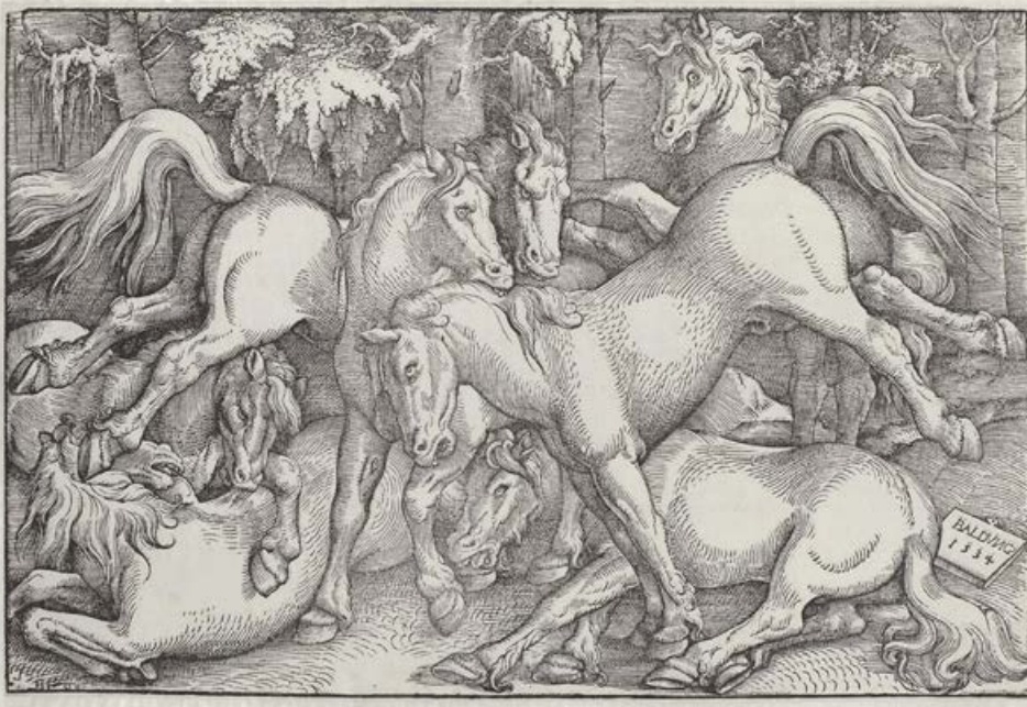
FIGUUR 2 ‘Wilde’ paarden vrij rondlopend in het bos. Gravure van Hans Baldung, 1534 (afbeelding: publiek domein).