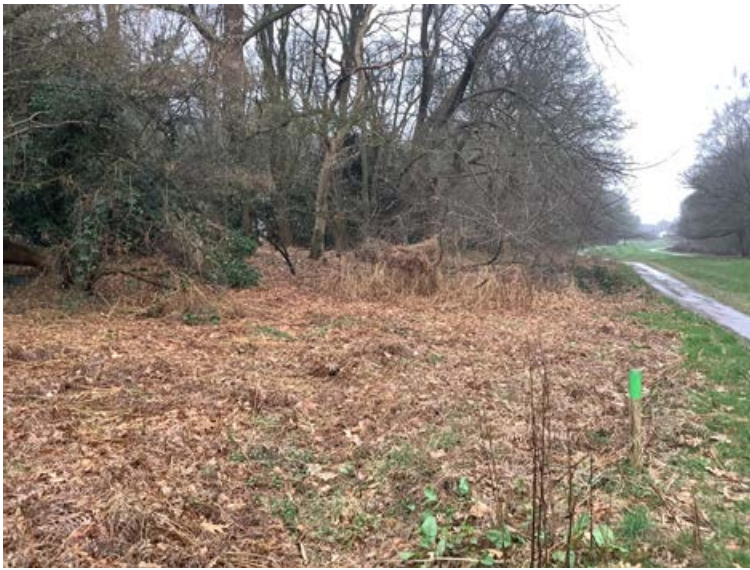
FIGUUR 6 Restant van een landweer in natuurgebied Hengstdal bij Nijmegen. Een landweer was een aarden wal begroeid met doornige struiken en aan weerszijden een greppel of sloot. Een landweer had vooral een defensieve functie, maar werd ook gebruikt als afscheiding/omheining voor paarden en andere dieren.

en het Hengelerveld, met als betekenis respectievelijk ‘omheind open bos’ en omheind onverkaveld open gebied’ (‘henge’ heeft de betekenis ‘omheining’, zoals in Stonehenge).