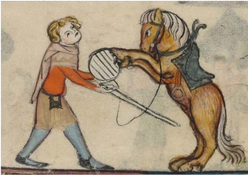
FIGUUR 4 Afbelding van een mogelijke 'custos' (waarschijnlijk 14 e eeuw) die een 'wild' paard probeert te temmen.