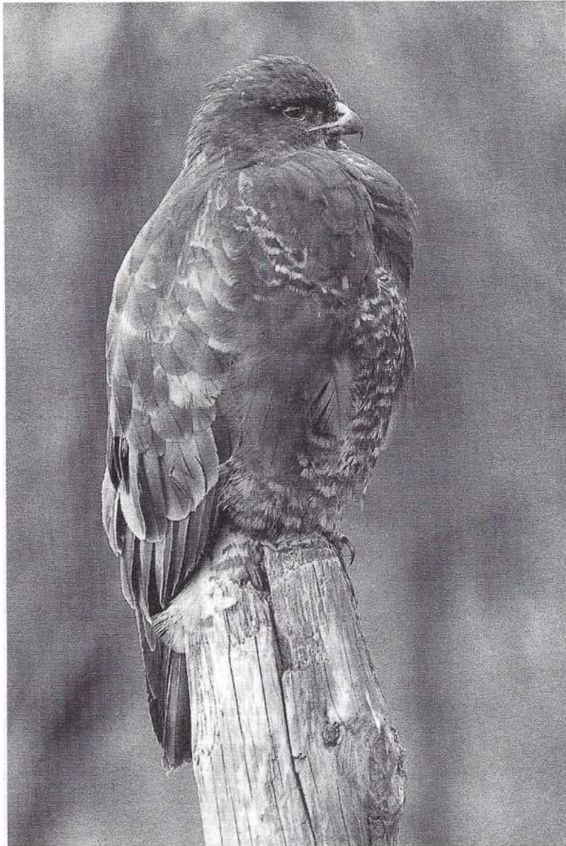
Af en toe foerageert de buizerd boven Bergen aan Zee.

Het uiteindelijke resultaat was dat van het Engelse Veld ongeveer drie ha. werd bebouwd en de overige ca 13 ha de bestemming duinterrein heeft gekregen. De uiterste noordwesthoek van de bebouwde kom - de Kuil - moest helaas worden opgeofferd ten gunste van villabouw. De vallei behoort niet tot het Engelse Veld.