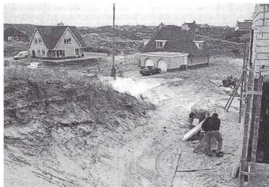
Rechts: Drie hectaren duin is verloren gegaan aan woningbouw in het Engelse Veld.