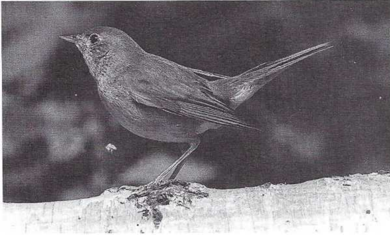
Ook de nachtegaal is als broedvogel gesignaleerd in het Engelse Veld.