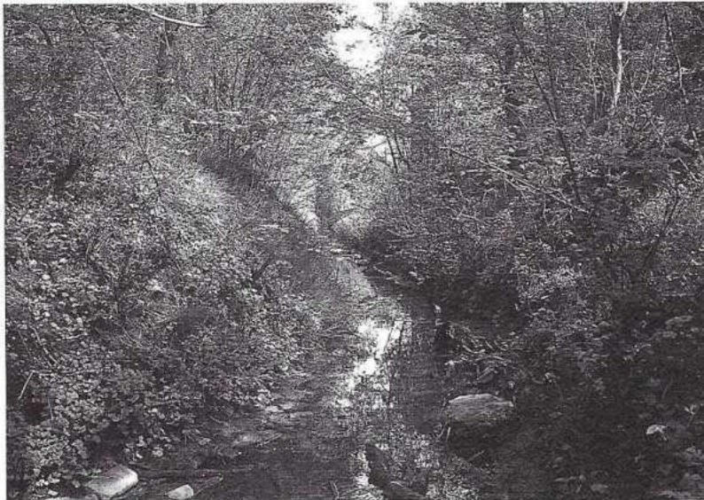
Landgoed Meer en Berg ligt in de rand van het duingebied. Hier komen de grondwaterstromingen samen en wordt het zogenaamde kwelwater afgevoerd via de duinrelen. Dit schone duinwater zorgt voor een gevarieerde natuur in de duinzoom.

sticht betaald moesten worden. Het privaatrecht won het bij de provincie van haar publieksrechtelijke taak. Geen woord over de grote waarden van Meer en Berg en geen woord over het provinciaal beleid voor de duinzoom, dat met voeten getreden is. Wel de obligate opmerking dat bij de inrichting rekening gehouden dient te worden met de omgeving. Hoe dat mogelijk is met 450 woningen, minstens zoveel auto's in de carport en even zoveel percelen met Gamma-schuttinkjes werd niet verhelderd.