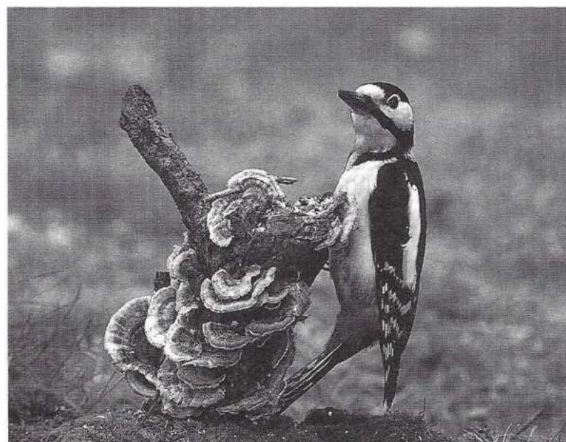
Landgoed Meer en Berg is rijk aan dieren. Van zeldzaamheden als boommarters en hazelwormen tot en met algemenere soorten als de grote bonte specht.

De hoop is ook gericht op de bestuursrechter in Den Haag, want er rammelt inmiddels al zoveel aan het besluitvormingsproces, dat er reeds voldoende munitie in voorraad is. Het ontwerpbestemmingsplan zal daar vermoedelijk nog een extra voorraadje springlading aan toevoegen. We blijven gemobiliseerd!