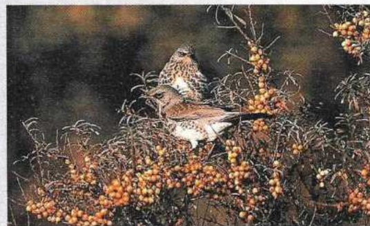
De kramsvogels doen zich te goed aan de duindoornbessen.

Vogeltrek is in de vogelwereld een belangrijke gebeurtenis. Iedere herfst is het voor veel vogelaars weer een vast ritueel van vroeg opstaan en snel naar de kust gaan om van de vogeltrek te genieten. Ieder jaar is het weer spannend, want je weet nooit van tevoren wat er gezien gaat worden. Elk jaar vliegen weer miljoenen vogels naar hun overwinteringsgebied en soms zitten er leuke of zeldzame vogels tussen.