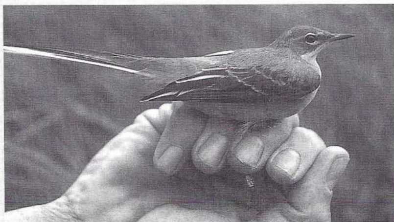
Een grote gele kwikstaart, gevangen op het vogel- ringstation. Met een rin- getje om mag de vogel weer verder vliegen.

waarschijnlijk jonge vogels. Bij het opvliegen vallen de lichte randen van de slagpennen goed op. Ze maken de verwisseling met een merel onmogelijk.