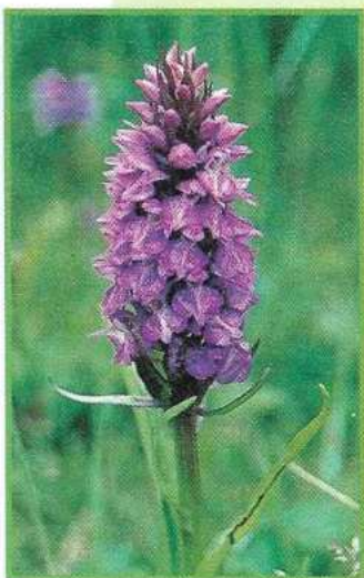
De rietorchis zal weer een algemene verschijning worden in de Luchterduinen.