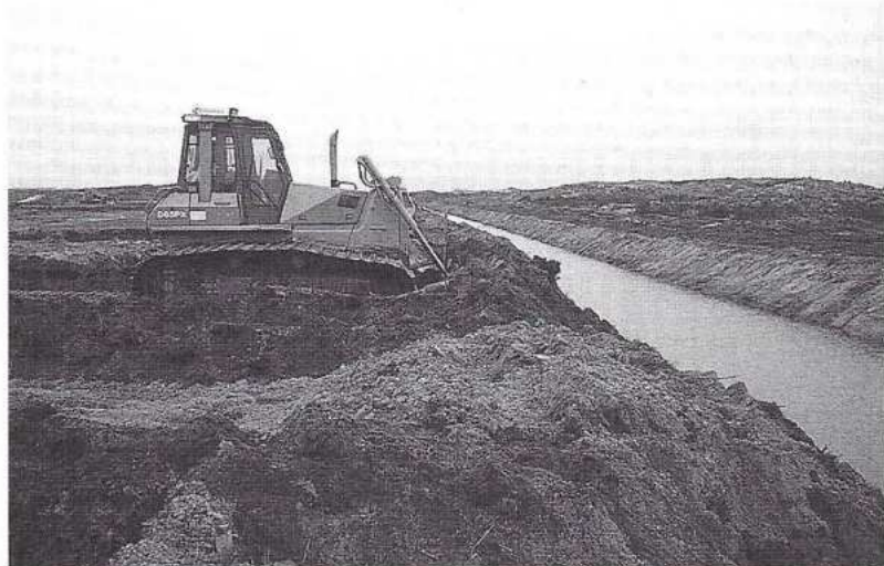
De bulldozer is bij natuurherstel een noodzakelijk kwaad. Op de foto wordt het Van Limburg Stirumkanaal dichtgeschoven.

damse Waterleidingduinen, of een systeem voor terugwinning langs het Oosterkanaal (interceptie) binnen de Amsterdamse Waterleidingduinen. In het zuidelijke en oostelijke deel van de Amsterdamse Waterleidingduinen is dan vernatting van 180 tot 220 ha verdroogde duinvalleien haalbaar. Bij ontwikkeling van een systeem voor interceptie bij het Oosterkanaal neemt de wincapaciteit daarbij ook nog eens toe. Met deze ingrepen zijn forse investeringen gemoeid (14 tot 33 miljoen gulden). Maar deze ingrepen in het zuidelijke en oostelijke deel leveren het hoogste natuurrendement op.