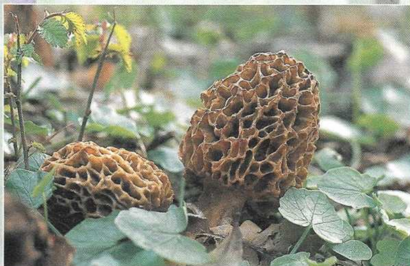
De morielje is een echte voorjaarspaddestoel