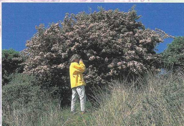
Een roze meidoorn in bloei op Ameland