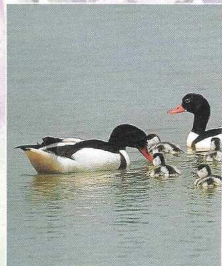
Vroeger kwamen er veel berg- eenden voor in de duinen.

Wie nu bergeenden met jon- gen wil zien is vaak aangewe- zen op de waddeneilanden