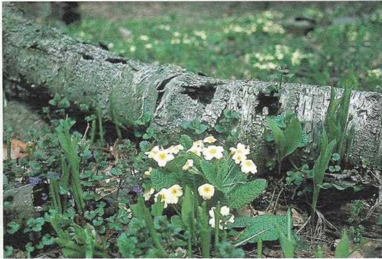
Vroeg in het voorjaar bloeit de stengel- loze sleutelbloem