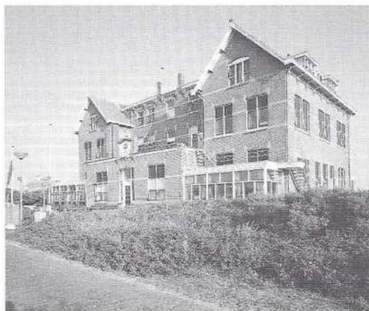
Het Zeehuis in Bergen aan Zee.

Ontdek ze vanuit de groene accommodaties van de Natuurvrienden. Op het zuidelijkste puntje van Finland staat het Finse natuurvriendenhuis Laupusten. Het heeft een eigen strand en, volgens goed Fins gebruik, een sauna. Naast zelfverzorging is ook volpension mogelijk. Je kunt er vissen, fietsen en boottochten maken. Ook aan de Duitse kant van de Oostzee liggen enkele natuurvriendenhuisen. Karlshagen ligt tegen de Poolse grens, daar waar de Oder breed uitwaaiert in zee. Bij de Hanzestad Lübeck ligt op het schiereiland Travemünde een huis aan de binnensee. En ook bij Kiel vind je een huis aan het Oostzeestrand. In Denemarken, 60 km van Kopenhagen, heeft het huis Hyllingeberg een eigen zandstrand. Hier vind je fossielen en barnsteentjes die door de branding gepolijst zijn. Voor een Brits kustavontuur kun je terecht in enkele vakantiebungalows aan de kust van Norfolk. Langs de beschermde kust voert het Suffolk Coastpath langs stranden en moerassen. Daarachter ligt het Hollands aandoende veenlandschap van het nationaal park The Broads. In Vlaanderen vinden we het Vissershuis. Van hieruit kun je zowel de duinen in als het Vlaamse land in fietsen, met trekvaarten en oude stadjes als Brugge. Op weg naar het zuiden is het aan te raden om eens de