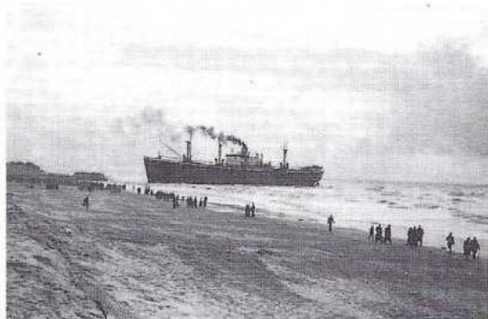
Op 21 december 1954 strandde de "Katingo" op het strand vlak voor Bergen aan Zee. Het schip was in ballast varende van Rotterdam op weg naar Hamburg.

Vanaf juli tot en met november zijn er in de loop der jaren vele duizenden zonnevissen aangespoeld (illustratie uit tentoonstellingsboek "Stormen en Strandingen").