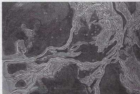
Een impressie van het Oer-IJ. Zo kan het gebied er rond Castricum, dat nu ongeveer in het midden van de foto ligt, er 2000 jaar geleden hebben uitgezien. De stippen geven archeologische vindplaatsen aan (Illustratie: Rob Beentjes).