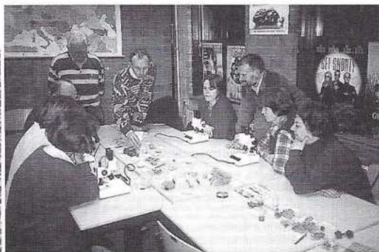
Een cursusavond in Leiden.

Het is belangrijk dat een grotere groep afweet van wat er zich aan leven afspeelt in de duingebieden. Het zou mooi zijn als er meer duincursussen gegeven zouden worden. Groepen die geregeld duinexcursies houden kunnen aan de