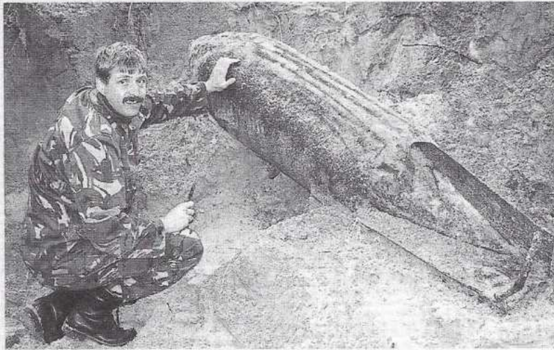
Bij natuurherstelprojecten komen regelmatig explosieven tevoorschijn. Deze bom lag vijftig jaar naast een wandelpad en naast een gastransportleiding voordat hij werd gevonden.

jaar lang met z'n punt uit de grond vlak naast een wandelpad en een gastransportleiding. En met nog een fors aantal natuurherstelprojecten op de rol mogen we nog heel wat springstof verwachten. Uiteraard is dit niet geheel zonder risico en het brengt bovendien vertraging van projecten en extra kosten met zich mee.