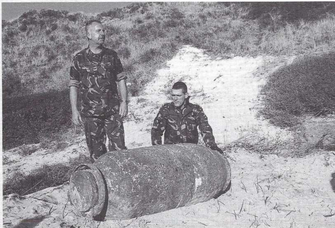
Bom Hermann, de zwaarste (Duitse) bom die ooit in de duinen gevonden is vlak voor de grote ontploffing, zoals deze op de achterpagina van DUIN te zien is.

Natuurherstel en -ontwikkeling wordt volop ter hand genomen. De oorspronkelijke situatie wordt waar mogelijk hersteld. Valleien worden afgegraven, zodat weer natuurlijke duinvalleien ontstaan. Zo ook in het Nationaal Park Zuid-Kennemerland tussen IJmuiden en Zandvoort. Bij een aantal grote projecten is echter vertraging ontstaan, omdat men stuitte op explosieven en onder het duinzand gestopte en vergeten bunkertjes. Zelfs een van de grootste Duitse bommen, ooit in het duin gevonden, kwam uit de grond bij een project in het Groot-Olden (zie achterpagina en foto hieronder). Soms liggen de explosieven bijna aan de oppervlakte. De vliegtuigbom op de foto stak vijftig