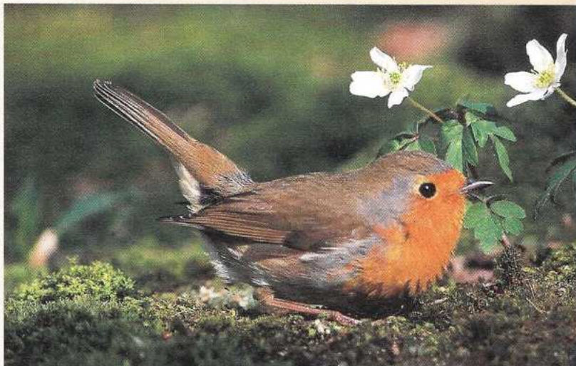
Een roodborst in het vroege voorjaar met bosanemoontjes.