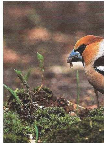
De appelvink is een zeldzame verschijning in de duinzoo. Op een aantal plekken langs de kust broedt deze neef van de vink.