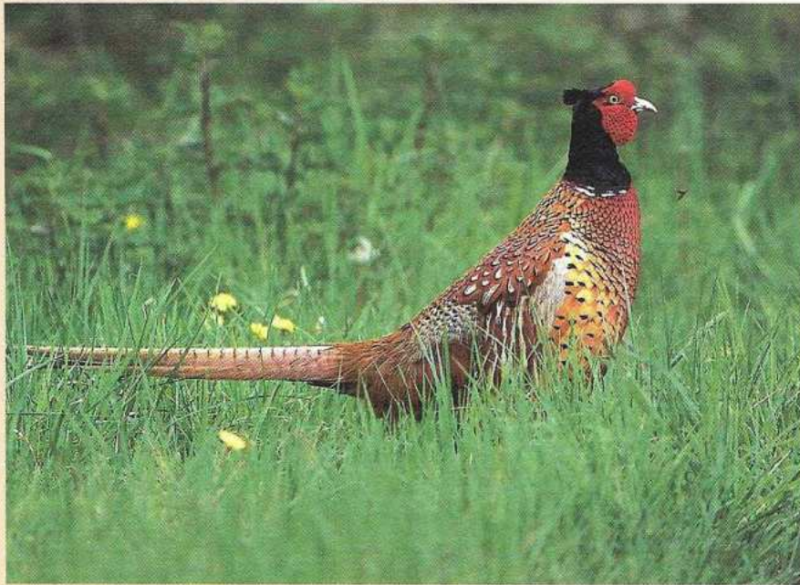
Sinds de jacht is stopgezet wordt er niet meer gevoerd en gefokt. De fazant is daardoor een zeldzame verschijning geworden in de duinen.