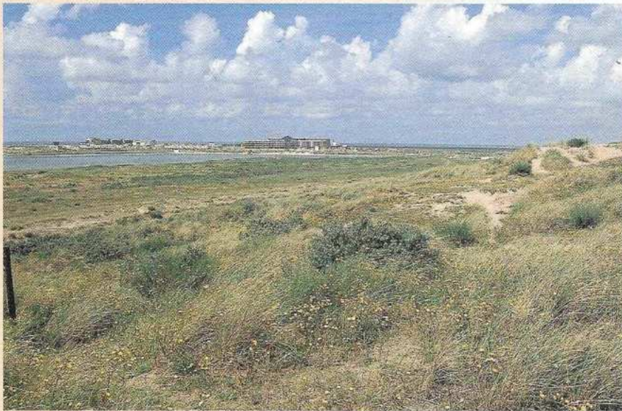
In IJmuiden blijft het rommelen. De ontwikkeling van een nieuwe strandweg zit muurvast en het ziet er naar uit dat de status quo nog lang in tact zal blijven. Helaas mocht van de Raad van State de Derde Haven wel worden aangelegd.

Ook de rietorchis profiteert van nattigheid en een beleid dat is ingezet op herstel van vochtige en natte duinvalleien