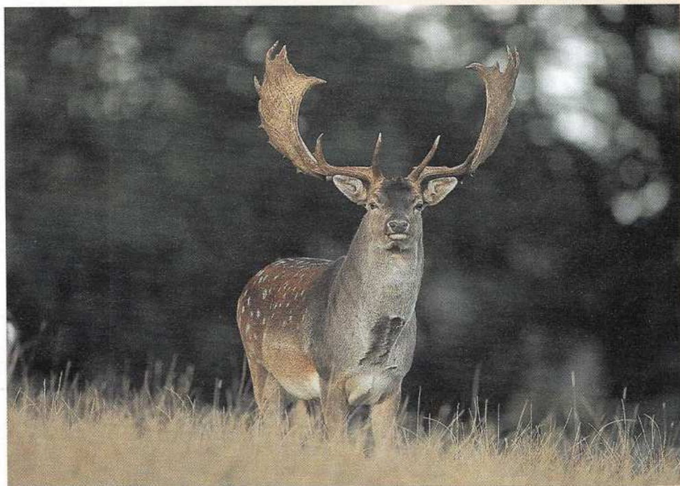
In 2000 werd een onderzoek afgerond naar ontsnippering van een deel van het Nationaal Park Zuid-Kennemerland. Daaruit bleek dat de forse groei van damherten een groot probleem kan gaan vormen bij ontsnipperingsmaatregelen.