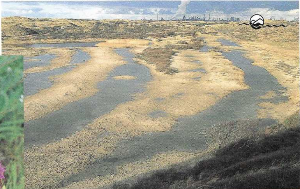
Niet iedereen is gelukkig met de overvloedige regenval en zoekt daarom een zondebok. In Zuid-kennemerland is die snel gevonden, namelijk het waterleidingbedrijf PWN, omdat deze organisatie vrijwel geen grondwater meer wint. Op de foto een natte vlei Het Houtglop in De Kennemerduinen.