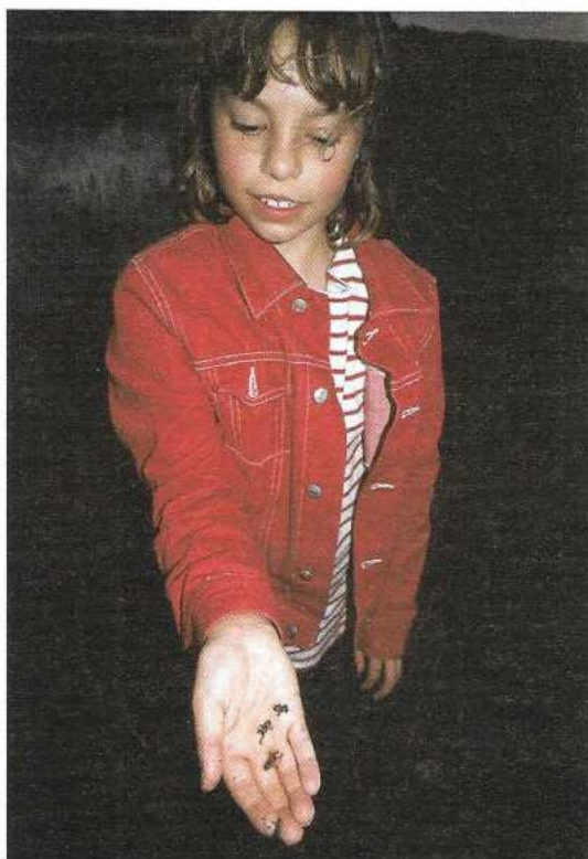
De belevingswaarde van water is groot, wanneer er bijvoorbeeld rugstreeppadjes te vinden zijn (foto: Sytske Dijkse/Foto Fitis).

in de diepte afnemen van 70 meter naar 40 meter en de bel onder de noordelijke duinen van 45 naar 20 m. De zoetwaterbel onder de Westerduinen blijft nog lang in stand en van grote diepte, al wordt de bel wel langzaam smaller.