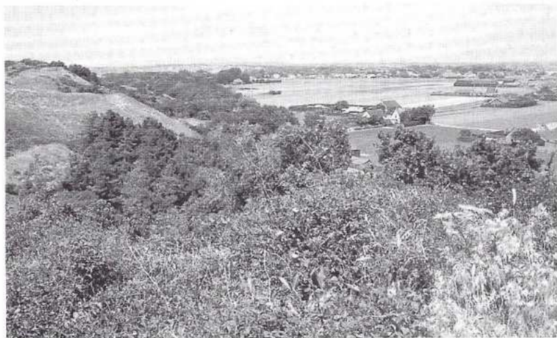
Direct achter de duinen liggen grote arealen bollenland.

schijf van 360 mm per hectare, 50 % van de jaarlijkse regenval. Als dit water zou worden opgepompt, dan heeft dit op langere termijn een grondwaterstandsaling tot gevolg van 10-25 cm, die merkbaar is tot op 500 m afstand van de put. Dat wil nog niet zeggen dat deze schade in de huidige situatie daadwerkelijk optreedt. De werkgroep concludeerde dat ondiepe onttrekkingen, binnen 15 m diepte, ecologisch meer schade doen dan diepe onttrekkingen, op 70 m diepte. Er werd voor gekozen deze ondiepe onttrekkingen bij voorrang te saneren, wat de grondwaterstand met 5 tot 10 cm (lokaal 25 cm) zou doen stijgen.