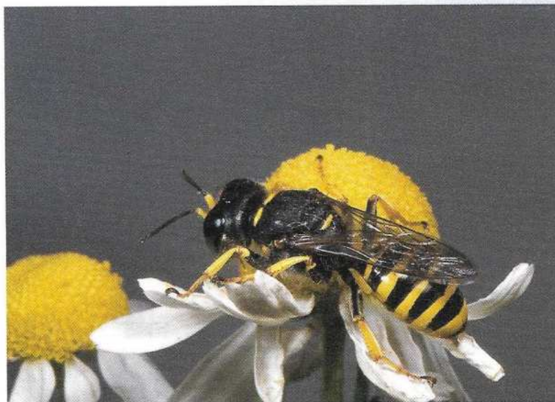
Een graafwesp ( Ectemnius sexcintus ) op echte kamille.

grootschaligheid een averechts effect hebben. Zo wordt vaak veel van het kleinschalig mozaïek weggevaagd. Speciale bomen en struiken, waar zeldzame bijen en vlinders hun biotoop vonden, dreigen te verdwijnen.