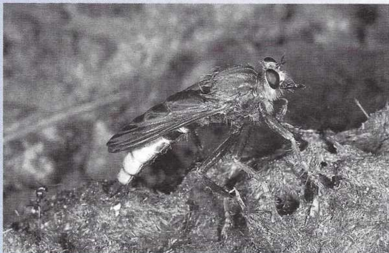
De hoornaar-roofvlieg Asilus crabroniformis.