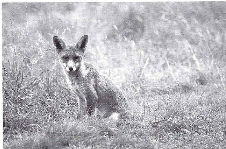
In de Amsterdamse Waterleidingduinen maakt u een goede kans een vos tegen te komen (foto: Henk Harmsen).

Opgave: 071 5160490 (Stichting Duinbehoud)