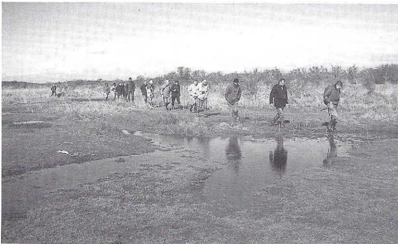
Goed schoeisel kan noodzakelijk zijn, zoals hier in de Kwade Hoek.

Opgave: 071 5160490 (Stichting Duinbehoud)