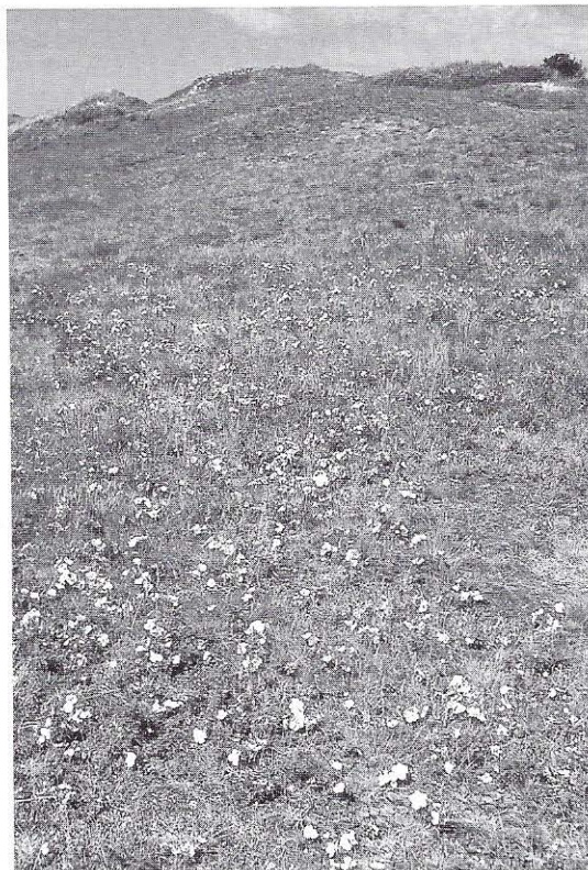
Duinroosvegetatie in de Wimmenummerduinen (Hanneke Mesters).