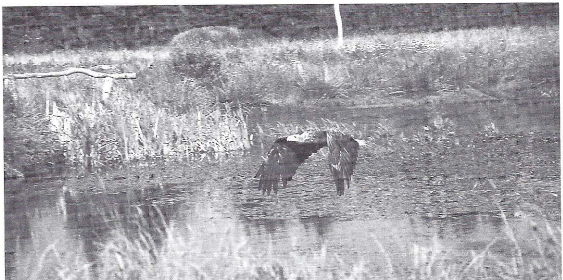
Jonge zeearenden verblijven graag op Öland.

Maar ook in het doorgaans minder aantrekkelijke zomerseizoen is er dagelijks veel te beleven. In de zomer van 2001 fietste ik elke ochtend naar het uiterste noordpuntje, waar twee juveniele zeearenden hun veren poetsten op een schiereilandje en de slechtvalk vanaf een boom aan de westkust boven zee jaagde. En op de camping lag een forse, zwarte variant van de adder op een hoopje stenen. Misschien niet voor iedereen een aanlokkelijk beeld, maar wandelen in de duinen is gevaarlijker met al die teken dan deze schuwe adder als vakantie-vriend.