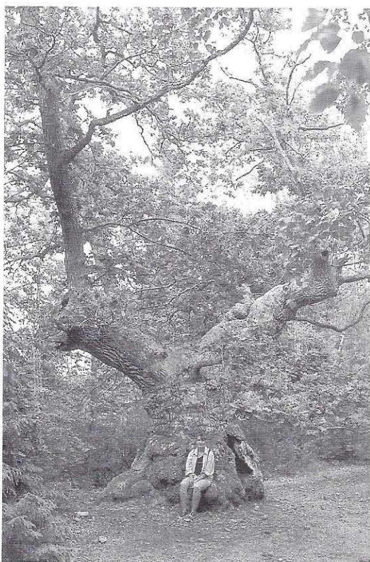
In Trollskogen staat deze eeuwenoude eik, op slechts een paar honderd meter van de Oostzeekust.

Het centrum van Öland is ook het domein van "skogens kungen": de koning van het bos. Wie wel eens een elandstier heeft ontmoet zal deze naam meteen snappen. Ooit zijn er elanden over het ijs gelopen of hebben de afstand zwemmend afgelegd. Zelf heb ik nooit elanden gezien op Öland, maar omdat elk jaar wel een toerist uit zijn auto wordt gezaagd door de rådningstjänst is zijn aanwezigheid onomstotelijk. Dus niet harder rijden dan de toegestane 90 km per uur en bij voorkeur in een Saab of Volvo. Dat kan veel leed voorkomen! Overigens zie je ook damherten op het eiland. Deze zijn ooit uitgezet door Karl X in de Gouden Eeuw. Ze lopen nu in het zuidpuntje bij Ottenby als een soort toeristenattractie tussen de schapen rond.