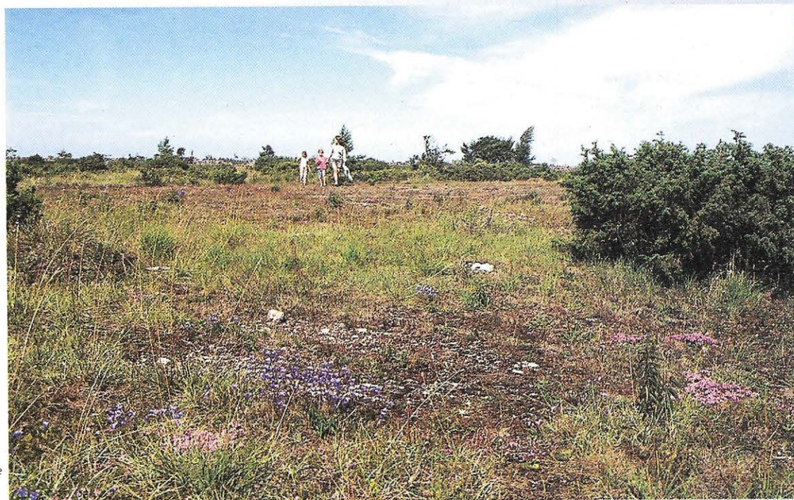
De Stora Alvarte is een eindeloze, droge kalksteenvlakte met oude stenen muurtjes en taaie plantensoorten.

De weemoed slaat weer toe. Het schrijven van dit verhaal maakt bij mij veel los. Een brandend verlangen naar een plek, waar de natuur zich toont van haar beste zijde. Een goddelijke plek, misschien wel het mooiste plekje dat ik ken. Öland, probeer het te vermijden, anders ben je voorgoed verloren.