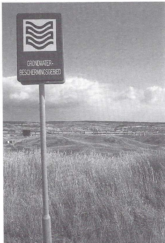
De omliggende duinen zijn tot stiltegebied verklaard.

habitat er volgens de internationale (race)normen niet geschikt voor is.