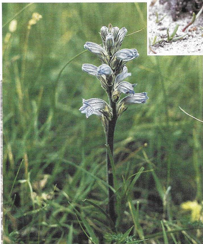
Duinbehoud verzocht de gemeente Katwijk recente gegevens van planten en dieren mee te nemen in de verdere planvorming van de Westerbaan. Zo werd er tijdens de inventarisatie door vrijwilligers van Duinbehoud het voorkomen van de blauwe brentaap vastgesteld.