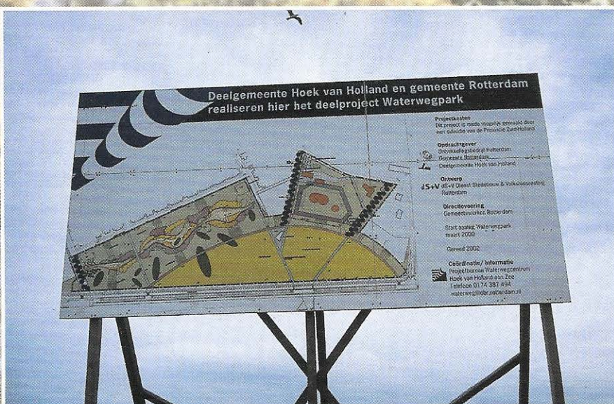
Voor het opruimen van een bouwterrein wilde de gemeente Rotterdam een zandzeefinstallatie in de duinen plaatsen. Duinbehoud heeft bij de provincie Zuid-Holland aangedrongen op het niet verstrekken van ontheffing. De provincie weigerde de gevraagde ontheffing te verlenen.

HET JAARVERSLAG 2001 IS TE BESTELLEN VIA 071 5160490 OF STICHTING@DUINBEHOUD.NL