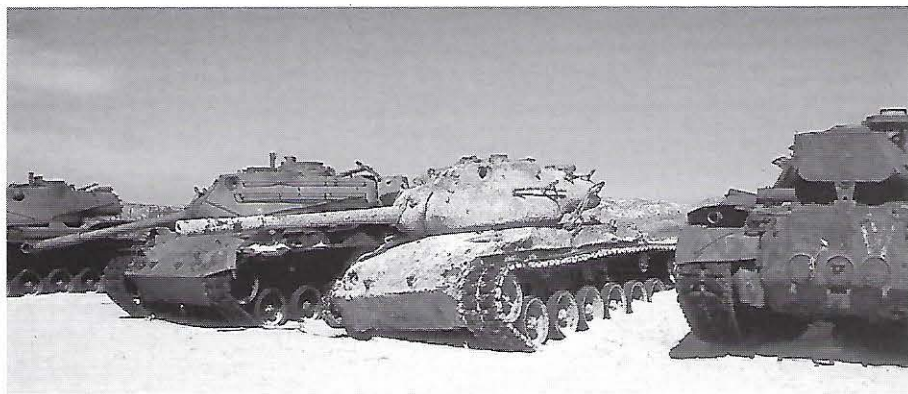
De gemeente Rotterdam heeft bij het plaatsen van de 'zandzeefinstallatie' vast gedacht: niet geschoten, altijd mis... (foto: Marc Janssen).

De provincie Zuid-Holland was van mening dat er geen ontheffing van de Natuurbeschermingswet nodig was voor het afgraven van een stuk duin bij het Haagse Kijkduin. De strook van 5 bij 30 meter moet weg voor de aanleg van een opstelstrook en een keerlus voor stadsbussen. Het is geen natuurgebied, wel 'duinpark' in het bestemmingsplan. Maar het grenst direct aan natuurmonument Solleveld. Duinbehoud vindt dat deze wet daarom wel degelijk van toepassing is. Dan kan het effect van de werkzaamheden en het parkeren van de bussen op het natuurgebied worden getoetst. Vervolgens kunnen eisen worden gesteld aan de afwerking en kan de schade misschien gecompenseerd worden. Bovendien