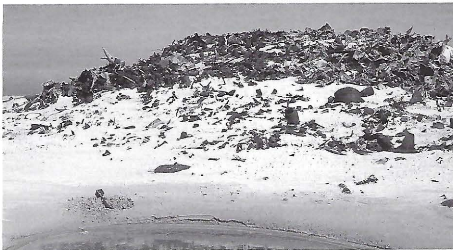
De milieueisen en de zorgvuldige toetsing, die voor iedere organisatie gelden, gaan blijkbaar niet op voor Defensie.

is niet uitgesloten dat het natuurgebied ook concreet aangetast wordt. Als je tot de gebiedsgrens duinzand weg graaft, blijft het restant van een duinhelling immers niet zomaar overeind staan. Een redenering die men bij de provincie kon volgen en uiteindelijk heeft willen overnemen. De wet zal alsnog worden toegepast.