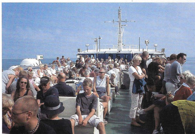
De waddeneilanden zijn erg in trek als vakantiegebied.