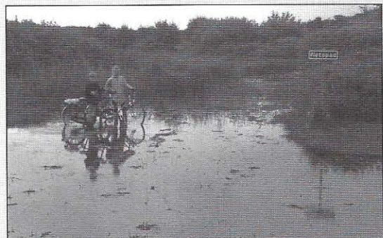
In de zomer zullen meer extreme buien met lokale wateroverlast optreden.

“Globaal komt het erop neer dat de temperatuur mondiaal en dus ook in Nederland de komende eeuw zal blijven stijgen. De opwarming van de aarde zorgt voor een versterking van de waterkringloop, en daarmee voor meer neerslag. Deze toename is niet homogeen verdeeld. We verwachten een versterking van de verschillen tussen nat en droog en een grote seizoensvariatie. In Nederland gaan we ervan uit dat er vooral in de winter meer neerslag zal vallen en dat er in de zomer meer extreme buien met lokale wateroverlast zullen optreden. De verandering van de totale hoeveelheid neerslag in de zomer hangt af van het gedrag van het water in de bodem. Als het warm is, droogt de bodem door verdamping uit. Dat versterkt de hitte met als gevolg dat er gemiddeld over de zomer minder neerslag valt. Eigenlijk hebben we afgelopen zomers al een voorproefje gehad van deze fenomenen. Al met al verwachten we dat de kans op extreem warme zomers toeneemt en de kans op extreem koude winters afneemt. Verder verwachten we een toename in de piekafvoeren van de rivieren en een versnelde stijging van de zeespiegel.”