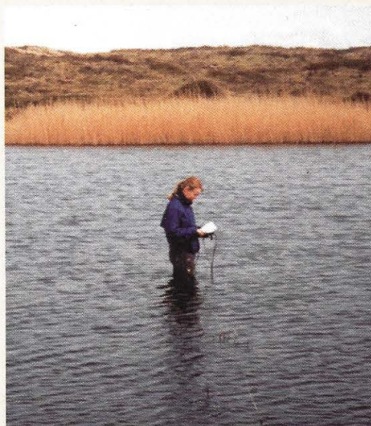
Metten in sterk vernatte duinen.

Om te onderzoeken of de concurrentiepositie