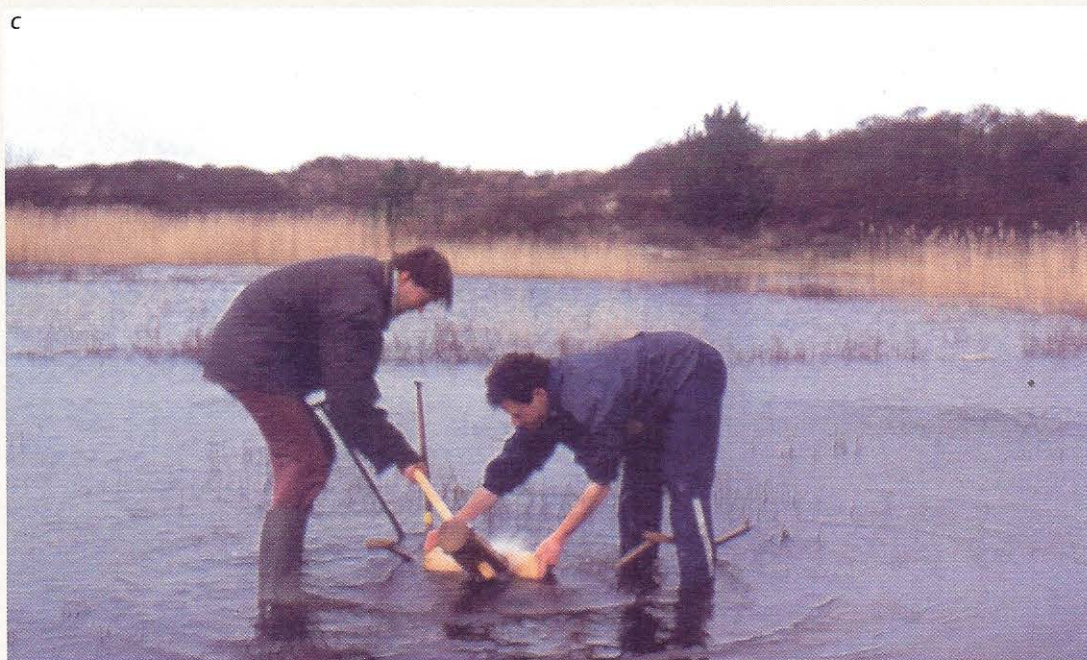
Het transplanteren van plaggen naar een nattere plek.

breidden zich heel snel uit nadat ze zich eenmaal hadden gevestigd (zie foto b). De nieuwe plantensoorten waren over het algemeen soorten met een voorkeur voor nattere plekken. Opvallend genoeg waren er onder de nieuwkomers maar weinig voedselminnende soorten. Deze snelgroeiende soorten bleken in de eerste tijd na vernatting dus niet van de nieuwe situatie te profiteren. Vergelijkbare patronen hebben we ook op plekken buiten de Kennemerduinen gezien. De karakteristieke soorten van natte, voedselarme omstandigheden bleken het meest te profiteren van plotselinge vernatting.