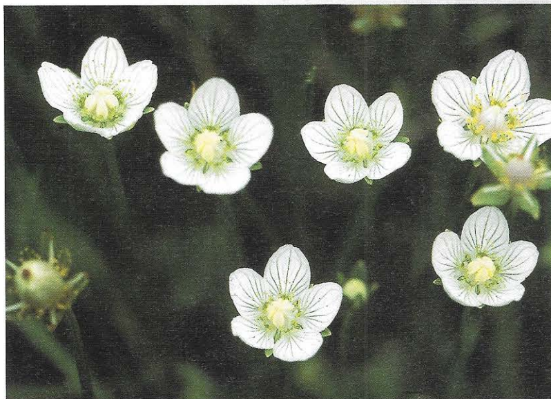
In de herstelde vochtige duinvallei groeien hele velden met Parnassia.

karakter. Door deze maatregelen zouden er weer bijzondere soorten kunnen terugkeren op het Groene Strand.