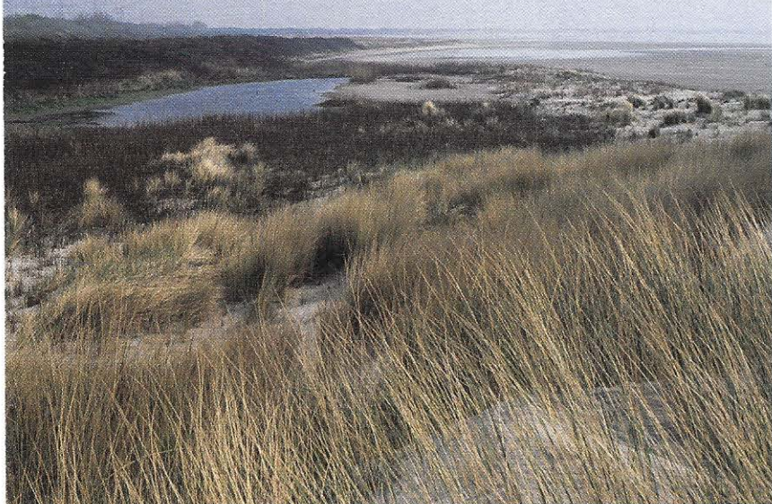
In 2001 is op de Westplaat een poel aangelegd.

zand aanwezig. De rugstreppad haalt af en toe het nieuws, wanneer er een bouwproject gestaakt moet worden vanwege het voorkomen van deze padden of zijn paddenvisjes. De rugstreppad duikt namelijk als pionier geregeld op bij pas opgespoten land en gronddepots. Naarmate een gebied meer dichtgroeit met bomen en struweel verdwijnt de rugstreppad en maakt plaats voor de gewone pad. Ook in zijn voortplantingswater heeft de rugstreppad het liefste zo min mogelijk begroeiing. Kale oevers en ondiep water zijn de belangrijkste kenmerken voor een geschikt voortplantingswater. Vooral tijdelijke wateren voldoen aan die eisen: vochtige duinvalleien, ondergelopen weilanden en laagtes in heideterreinen, maar ook regenplassen op opgespoten zand. De rugstreppad meet ongeveer acht centimeter en lijkt verwarrend veel op een doodgewone pad. De rugs-