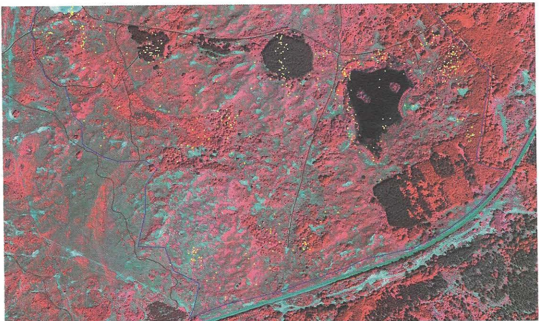
De posities (geel) van de wisenten tussen 1 juni en 12 juni.

HUBERT KIVIT IS ADVISEUR NATUUR EN RECREATIE BIJ PWN WATERLEIDINGBEDRIJF NOORD-HOLLAND.