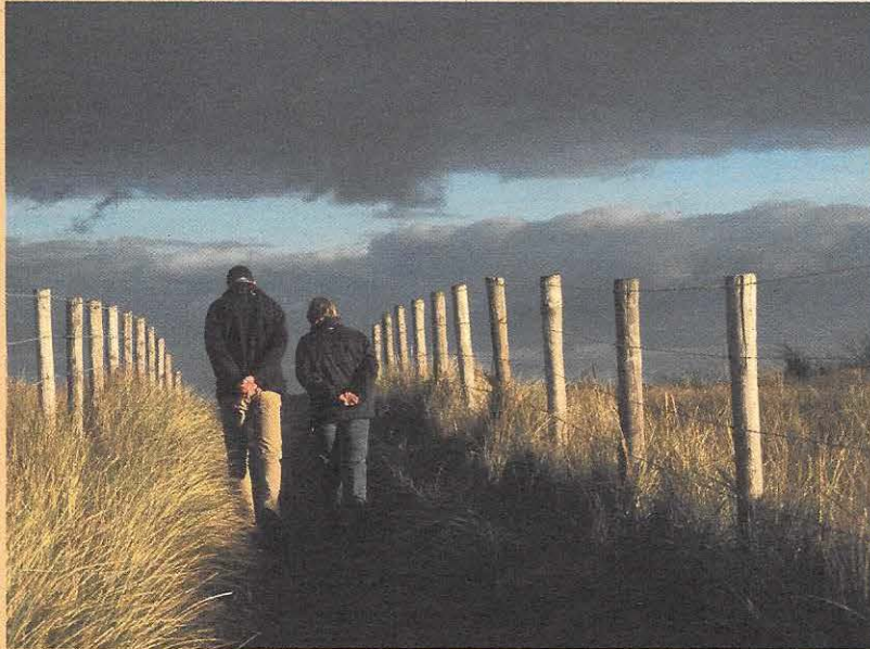
Wandelen en fietsen zijn al decennia de meest populaire activiteiten.