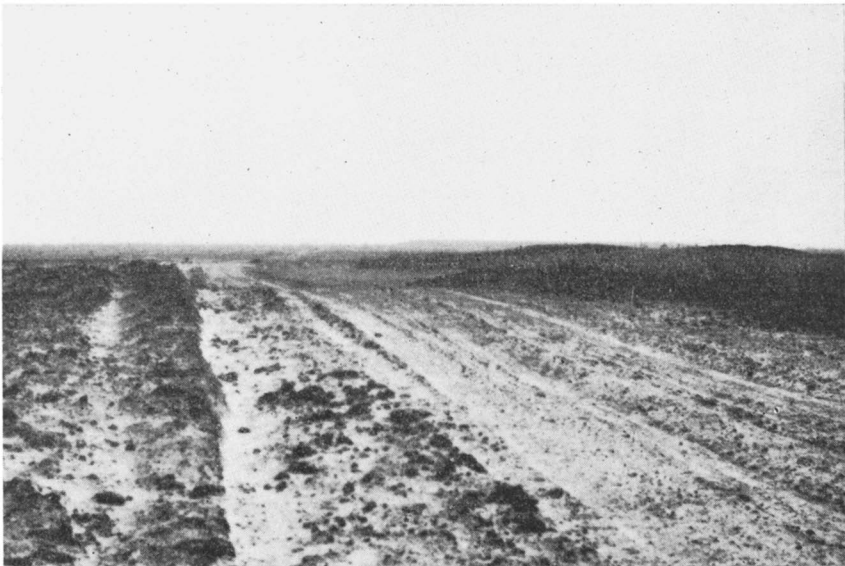
Fig. 14. Twee evenwijdige ruggen, van links naar rechts, gesneden door een weg.