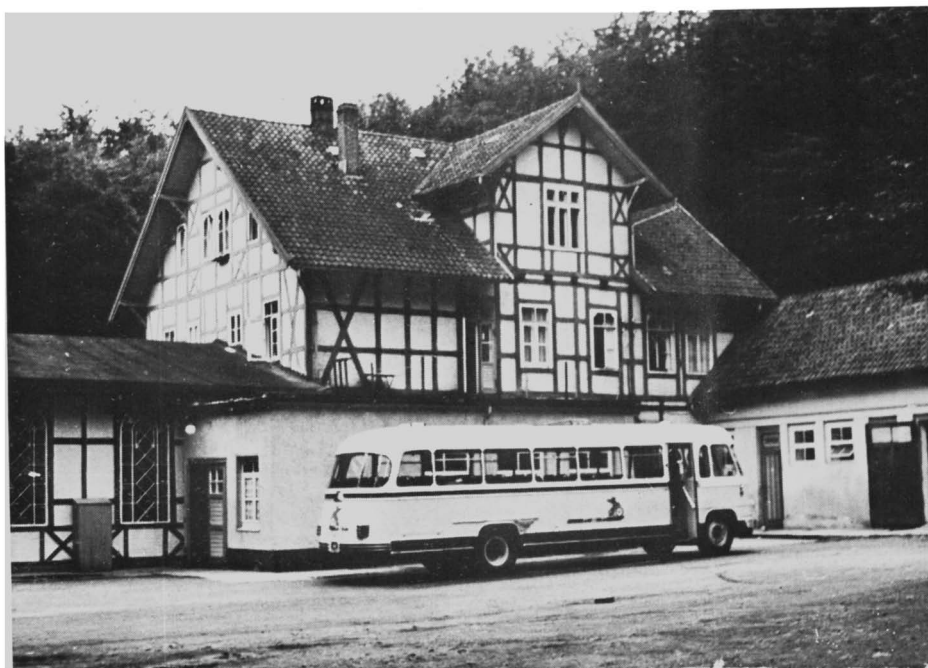
Hotel Deisterpforte - Bad Springe am Deister.

de bus en verdwijnt één onzer in een van de aardige huisjes, waar dikwijls de gastheer al staat te wachten. De bus wordt steeds leger en tenslotte keren we met de thans geheel verlaten bus naar ons hoog gelegen hotel terug.