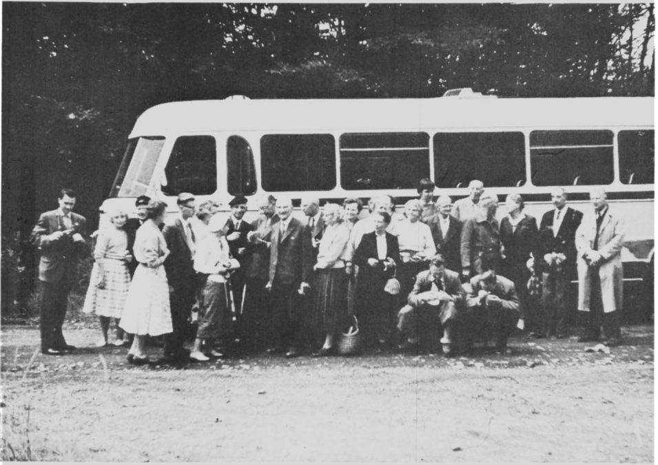
Het gezelschap in het natuurreservaat Hohenstein