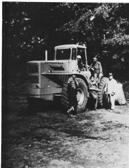
De Werkmeister en zijn mannen in de groeve met kulkwartsiet bij de Bismarckturm in die Seiler.

Op enkelen na bereikten de meesten door een inmiddels overkomende donderbui nat geworden, de Feldhoff-