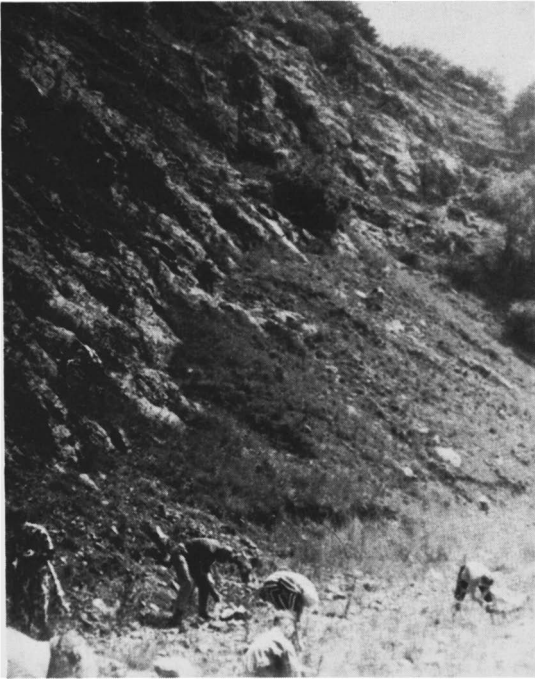
Grube Nie bij Lethmathe. De deelnemers aan de arbeid aangevuurd door het succes.