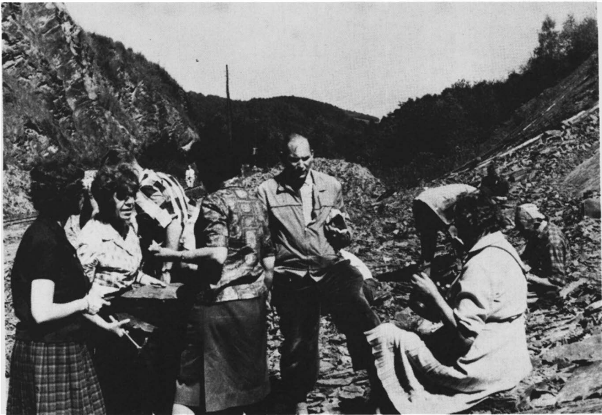
De eerste aanval op de Devoonkoralen in de groeve bij de Dechenhöhle.