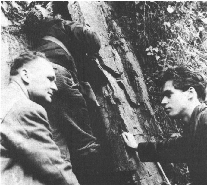
Foto 1: Exploratie in de Honselers Schichten in Ziegelei Stenglingsen.

In de richting Lethmathe vervolgden we bij Lasbeck de linker-oever van de Lenne in noordelijke richting en bezochten de Ziegelei Stenglingsen.