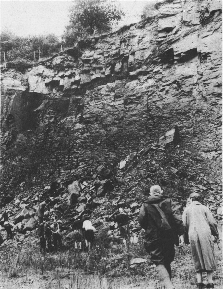
Foto 4: De Karboongroeve aan de weg van Herbede naar Witten. De koollaag is duidelijk te zien.