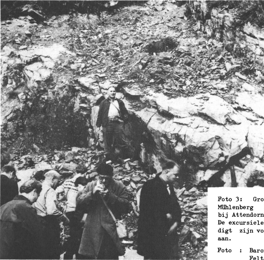
Foto 3: Groeve in de Mühlenberg sandstein bij Attendorn. De excursieleider moedigt zijn volgelingen aan.

Na dit bezoek en een koffiepauze reden we het Repebachtal in naar Helden. Het lag in de bedoeling om bij Mecklinghausen het "Heldenmarmor" met doorsneden van goniatites te zoeken, maar door een fout in het kaartlezen van de excursieleider waren we de plek al ver voorbij, voor dat we dit ontdekten en daar keren op deze smalle weggetjes onmogelijk is, werd dit deel van het programma overgeslagen.