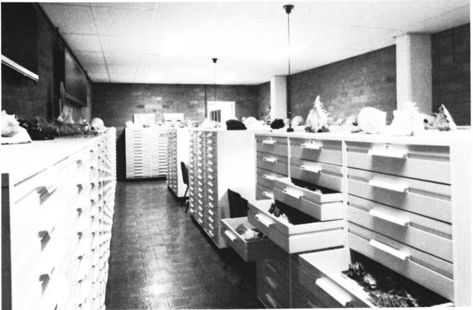
Studieverzameling met ladenkasten