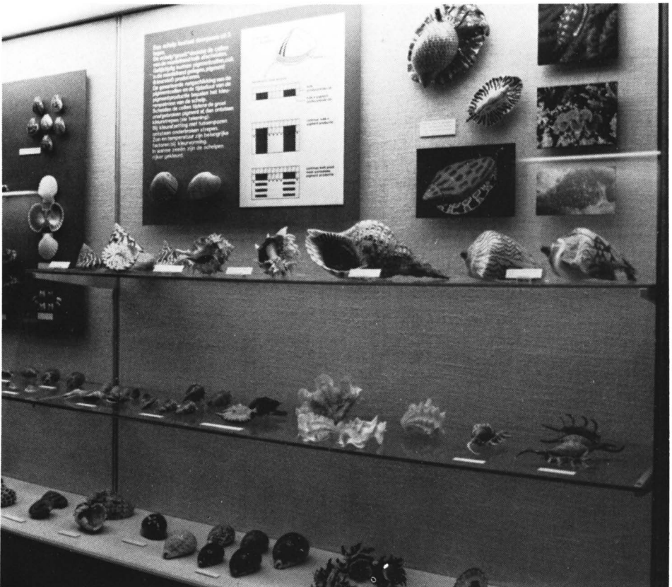
Paneel ter verduidelijking van groei- en kleurvorming in een schelp