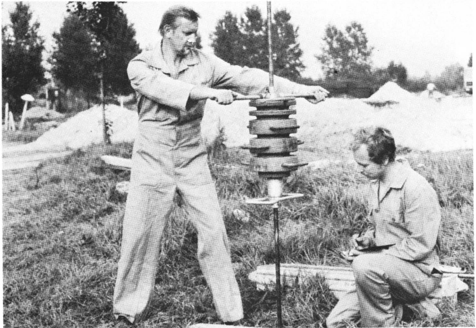
In het vrije veld