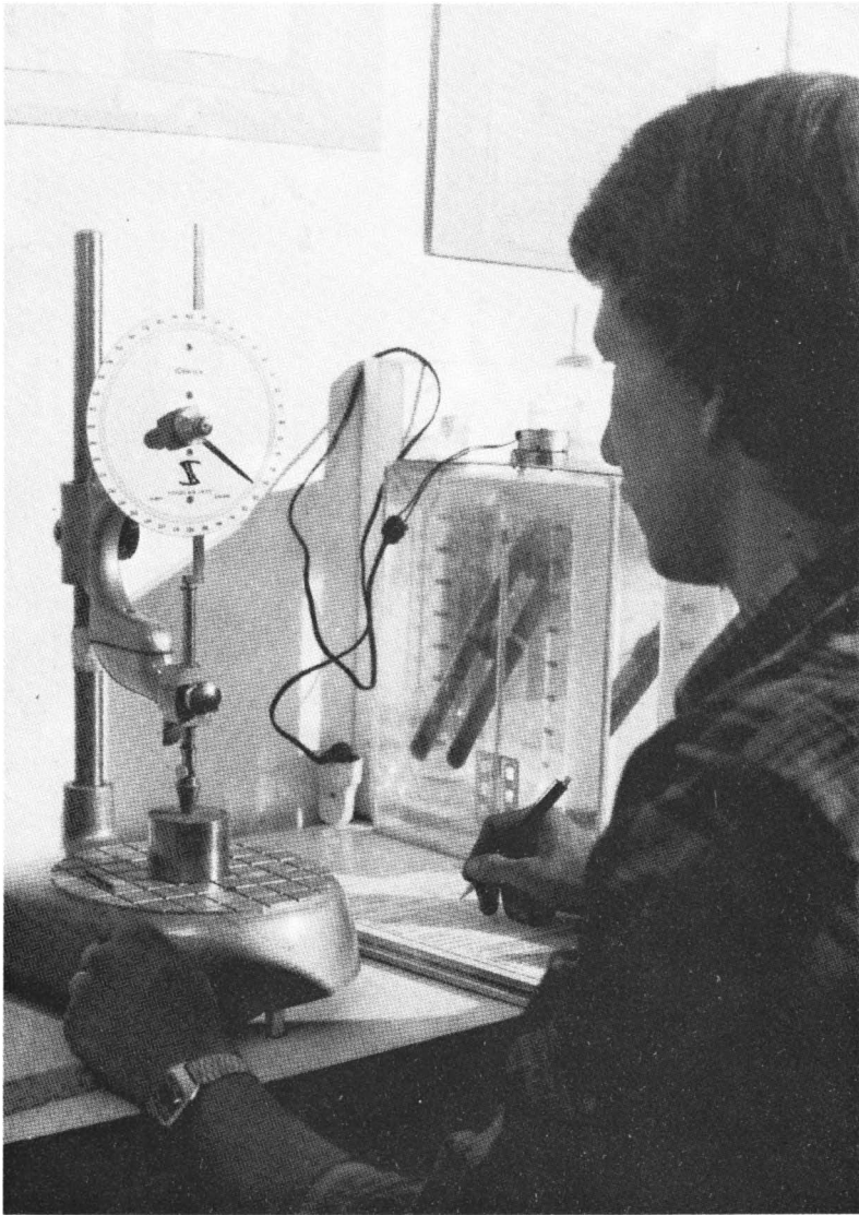
In het laboratorium

Terreinen met onbekende ondergrond, moesten voor nieuwe wijken, buiten de oude stadskernen ontsloten worden. Waarom worden tegenwoordig overal op bouwterreinen onderzoeken verricht? Vroeger kende men op grond van slechte ervaringen de ongeschikte bouwterreinen en ging deze uit de weg. Dergelijke gegevens zijn vaak verloren gegaan en ook door gebrek aan ruimte moeten vaak minder geschikte terreinen bebouwd worden. Het bureau staat tegenwoordig onder leiding van drie geologen en een bouwingenieur en heeft een bijkantoor in Lingen. Het beschikt over de modernste, soms zelf ontworpen apparatuur voor geofysische sonderingen in het vrije veld en bodemphysicalische onderzoeken in het laboratorium. Het bureau is raadgevend bij hoogbouw, bouw van bruggen, straten, zwembaden, sportterreinen, afvalverwijdering, milieubescherming enz.