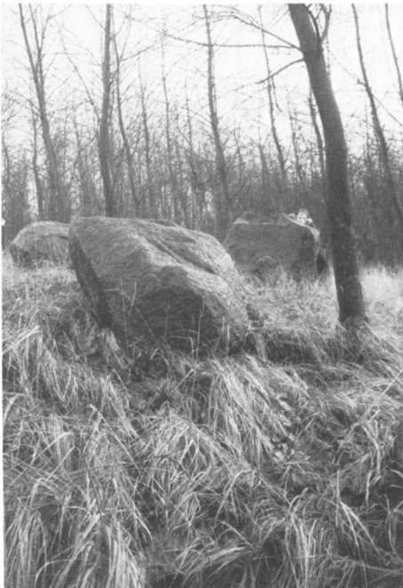
Grote keien in het Urkerbos