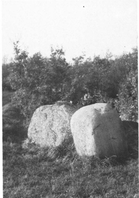
Geologisch reservaat 'Van der Lijn'