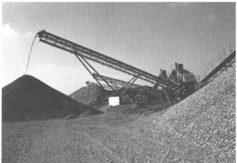
Fig.1. Veredeld grind.

De Holding zoekt op haar terreinen vooral emplot in de Euregio. In die strategie past, als dynamisch middelpunt van deze streek, de aankoop van de Gemeentehaven van Stein toen die in 1987 geprivatiseerd werd. Deze functioneert nu als Haven Stein B.V. die op haar overslagterrein veel ruimte biedt aan alternatieve en secundaire wegebouwmaterialen.