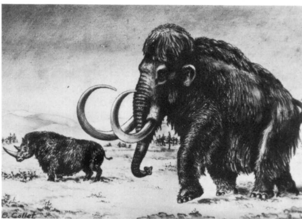
Reconstruktie-schildering in het RGM van mammoet en neushoorn tijdens een van de IJstijden, door B. Collet, een van de medewerkers van het museum.

Tegenwoordig zijn er, ook wat het RGM betreft, veranderende tendenzen merkbaar: meer gerichtheid naar buiten, buiten de universitaire wereld. Dat zou onder meer tot uiting kunnen komen wat de organisatievorm betreft, als het RGM zou worden losgekoppeld van de universiteit en een zelfstandige status zou krijgen. En dat zou voor ons, belangstellende buitenwereld, wel eens een gunstige ontwikkeling kunnen zijn.