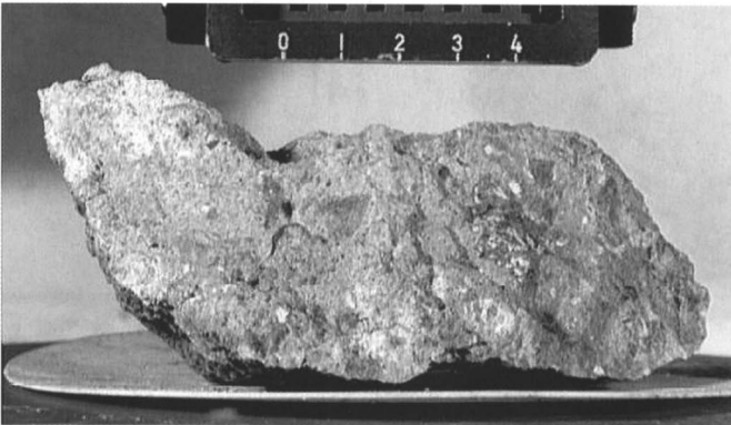
Afb. 2. Een stuk maansteen, afkomstig van de missie met de Apollo 17

$500/g (0.5 - 0.64kg), $400/g (0.65 - 0.85kg), $300/g (0.86 - 1.5kg) Vanzelfsprekend zult u verificatie omtrent de echtheid ontvangen nog voor u koopt. Ik geloof dat, wanneer u echt geïnteresseerd bent, wij elkaar eens persoonlijk moeten ontmoeten om een overeenkomst te sluiten. Graag uw commentaar. Hoogachtend, Orb Afb. 2.