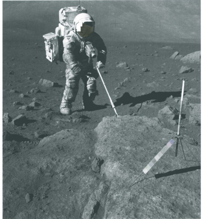
Afb. 3. Het verzamelen van stukken maansteen door een Apollo 17-astro- naut

Maanstenen zijn doorgaans licht van gewicht en vaak ook van kleur en bestaan vaak uit basalt of breccie ten gevolge van grote meteorietinslagen waarin twee of meer gesteenten door de hitte aan elkaar zijn gesmolten. Basalt bevat meestal nog een aantal andere mineralen, zoals pyroxenen, olivijn en veldspaten. Gelukkig is er een onfeilbaar middel om maanstenen te herkennen: de zogenaamde zap-pits . Afb. 3. Omdat de Maan, in tegenstelling tot de Aarde, géén atmosfeer heeft slaan ALLE zand en stofkorreltjes uit de ruimte daar in met een snelheid van tussen de