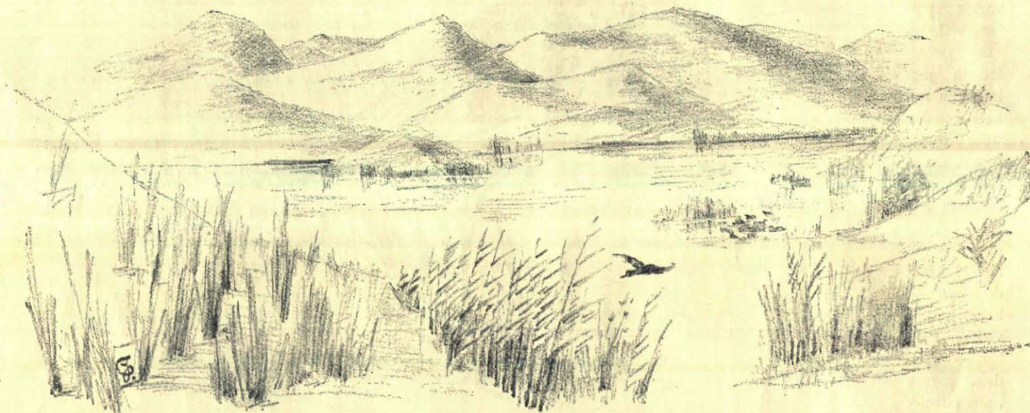
Het meertje in de duinen.

Geheel „op” van vermoeienis en teleurstelling kwamen we eindelijk tegen zessen bij het kleine kistje aan. Lang uitgestrekt in 't heete zand gaven wij daar elkander onze meening ten beste over deze duinen en over konijnenpest en stroopers. Toen kwamen weer jachtgesprekken. Daar fleurden we in deze omstandigheden weer wat van op. Het nieuwe centraalgeweer werd bekeken en bestudeerd en — ik weet niet, wie het voorstel er toe gedaan heeft — we organiseerden een schietwedstrijd, om te zien welk van de twee geweren de meeste trefkans gaf, Lefauchaux of Centraal. Een losse bodem uit het kleine kistje diende tot schijf; bij elk schot werd die met een nieuw stuk papier bedekt, waarin dan het aantal hagelgaten door telling of schatting bepaald werd. Dat was me een geschiet van