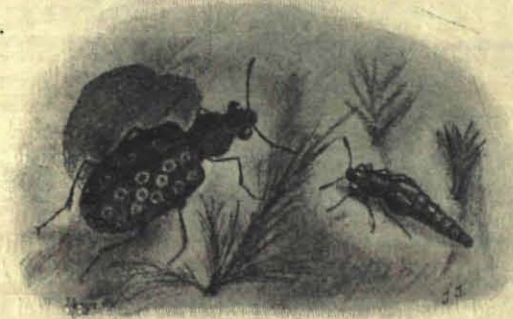
Oeverkever ( Elaphrus ) en Kortschildje ( Stenus ), 4 maal vergroot.

Hier zijn we bij eene sloot. Nog in het laatst van November was hier eene heele vegetatie! Wel waren er toen al heel wat soorten naar den bodem gedoken, maar toch zag men nog de fijn verdeelde bladen van schermbloemen, de haarsteng, de waterviolier en andere planten. Ook thans kunnen we voor het aquarium nog bijdragen verzamelen. We letten maar op verdorde stengels, welke van de bloeiende waterweegbree en van andere planten zijn overgebleven, en graven dan de overwinterende wortelstokken uit. Misschien hebben menschenhanden ons elders reeds geholpen, door deze of gene sloot eens uit te diepen en al, wat ons hart maar begeeren kan — pijlkruid, lisch, kalmus, egelskop, nymphaea — als mest op den kant te werpen!