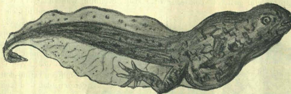
Larve van de Knoflookpad ( Pelobates fuscus ).

Van alle kikvorschen en van al onze Nederlandsche padden op één na is Pelobates dadelijk en gemak-