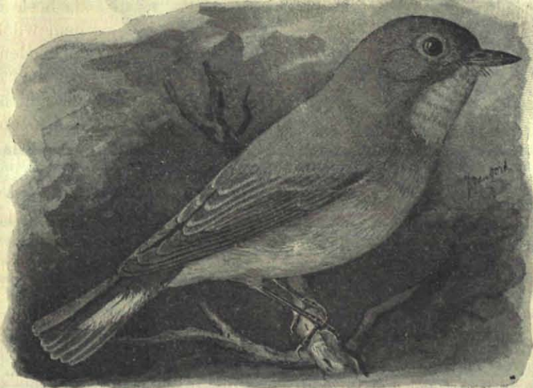
Kleine Vliegenvanger ( Siphia parva (Bechst)). Naar het exemplaar uit de collectie DE GRAAFF, voor De Levende Natuur geteekend door J. VAN OORT.

Dat weet ik tot op de huidige dag niet en dat is 't juist, wat mij leed doet. Wel is bij mij een vermoeden gerezen, dat ik de zoo zeldzame kleine vliegenvanger, Siphia parva (Bechst.) voor mij had, maar zekerheid daaromtrent bezit ik niet. Alles is mogelijk, maar de waarschijnlijkheid, dat het dit vogeltje is geweest, is niet groot. Wel wordt de kleine vliegenvanger tot de Nederlandsche vogels gerekend, maar hij be-