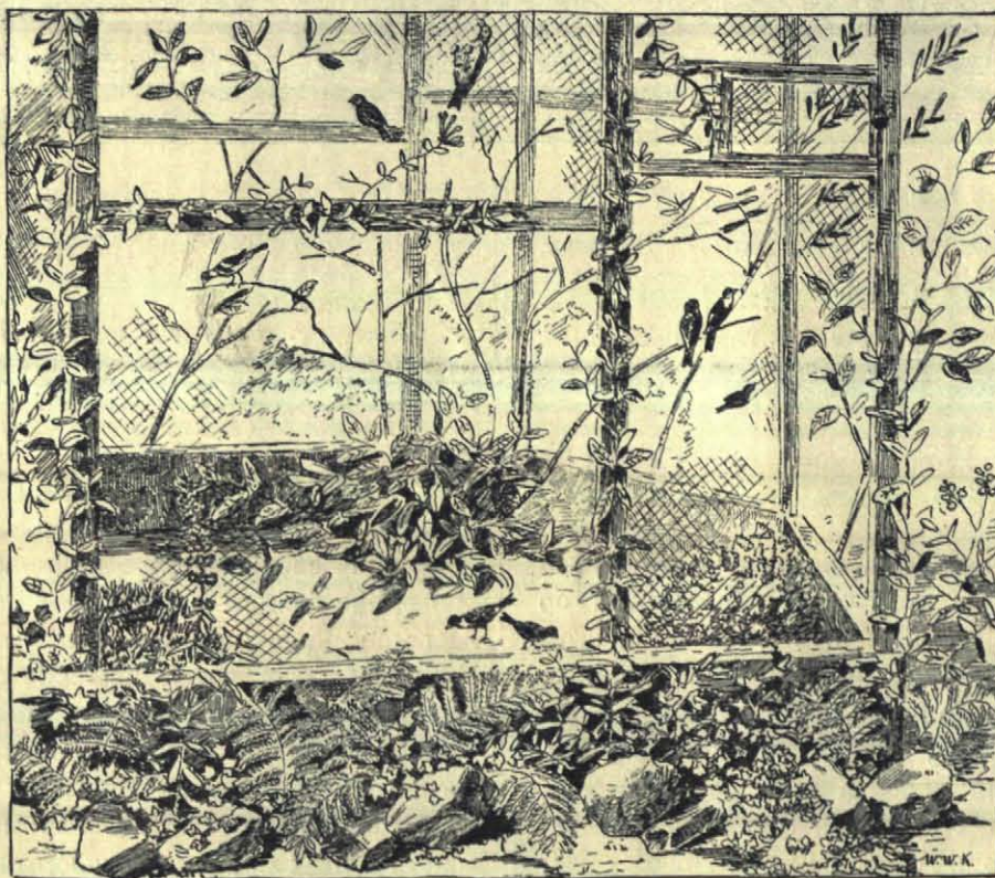
De gorzen bewegen zich op den bodem.

komt zeer algemeen voor, op IJsland en broedt ook op Nova-Zembla en Spitsbergen. Beiden komen in den winter bij ruw weer, sneeuwstorm en vorst, naar 't zuiden en bezoeken dan ook ons land. Ze worden dan voornamelijk aan 't strand gevonden, ofschoon de sneeuwgorzen ook wel dieper landwaarts komt. Vóór een jaar of wat zijn er bij Lochem